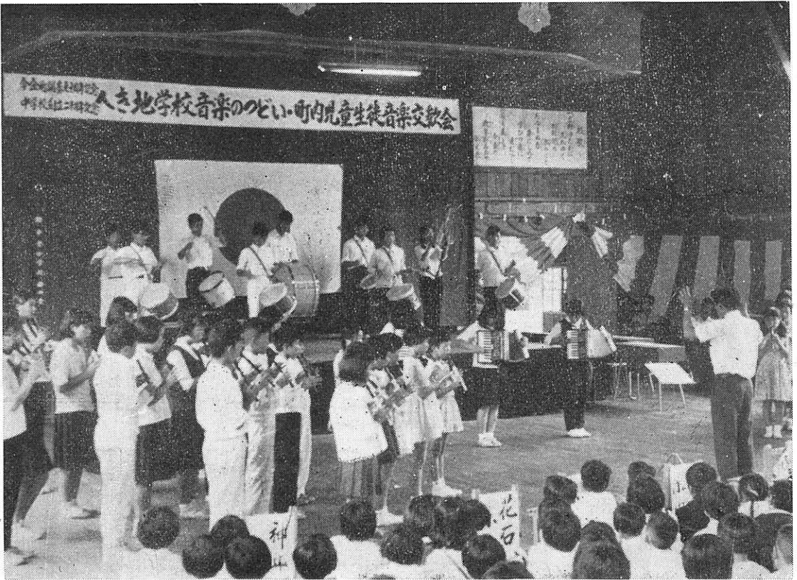
写真=開基70周年記念協賛行事『音楽のつどい』