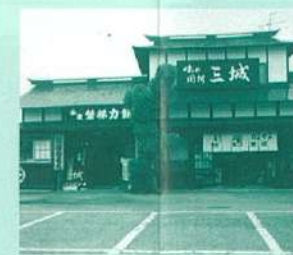
10 旅食房 三城