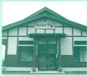
14 手打ち蕎麦 十察