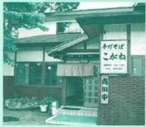
15 手打ちそば処 こがね