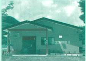
17 農家レストラン結