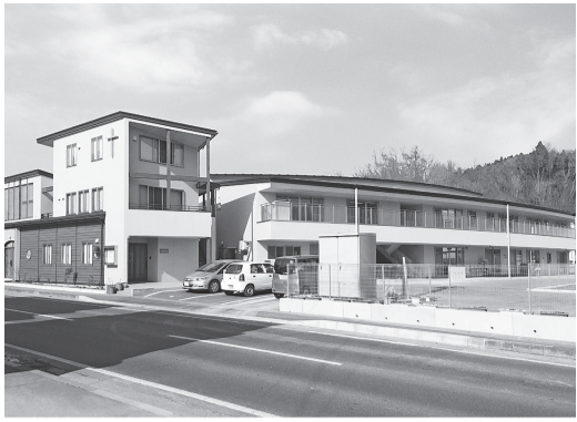
右川色水遊び、乾杯！ 上川教会（左）と認定こども園（右）建物