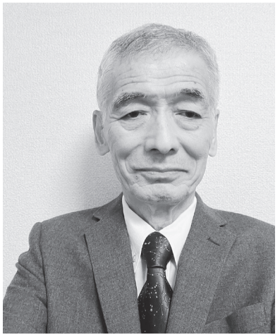
1941年生まれ、本多記念教会員