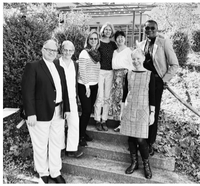
東日本大震災時、EMSから日本基督教団に多額の支援金が送られた。また部落解放センター、教団活動、アジア学院等のためにも支援をいただいている。EMSは南西ドイツの教会の働きと基金が元となって始まった活動だが、今は国際的な広がりを見せている。その申請書類について検討するのがProPro委員であり、ドイツ、インドネシア、中東、アフリカ、インド・東アジアのそれぞれの地域から計6名の委員が選出される。

9月19〜21日にドイツのシュトゥットガルトにてEMSのProPro委員のシフトアウトガルトに会が行われた。