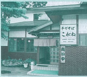
17 手打ちそば処 こがね