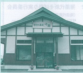
16 手打ち蕎麦 十楽