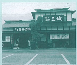
12 旅食房 三城