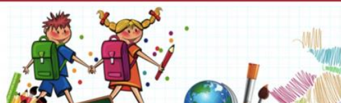
学校連絡・情報共有サービス「COCOO」