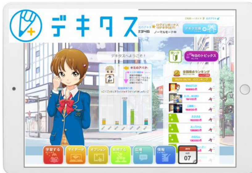
小中学生向けオンライン学習教材「デキタス」

「デキタス」ホームページ : https://dekitus.johnan.jp/