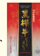
※画像は1個ですが、6個セットでお届けします。