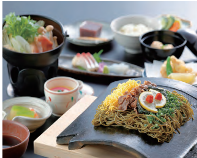
※瓦そばは2人前です。 ※写真はイメージです。

館内の食事処「瓦そば本店お多福」で川棚名物「瓦そば」を中心に地元の素材を活かした瓦そば会席をお楽しみください。