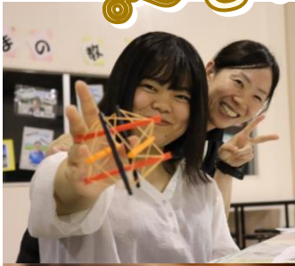
ストローと輪ゴムで テンセグリティづくり