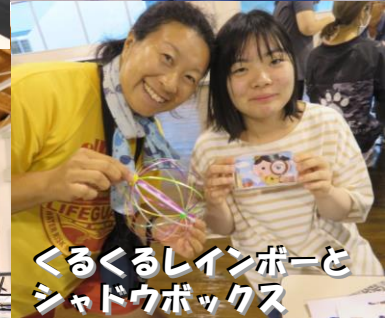
くるくるレインボーと シャドウボックス