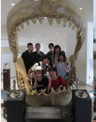
自由参加の オプション 海洋博公園