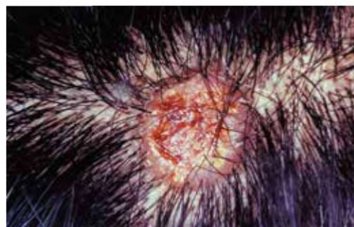
(写真3) 梅毒 扁平コンジローマ

第二期に進行し、治療を受けずにいると3年後には第三期、10年後には第四期へと進行します。この時期では梅毒スピロヘータは体内の血液中から各臓器内へと移行しますが、スピロヘータそのものの量は少なくなるといわれていますので、他人への感染性は第一、二期よりもはるかに少なくなります。現在では、何か他の病気で抗生剤を使用する機会も多いので、知らないうちに梅毒の治療が済んだ状態になり、第三、四期まで進行することは極めてまれです。しかし、もし、第三、四期まで進行すると生命に関わる重篤な症状が起こるので注意が必要です。