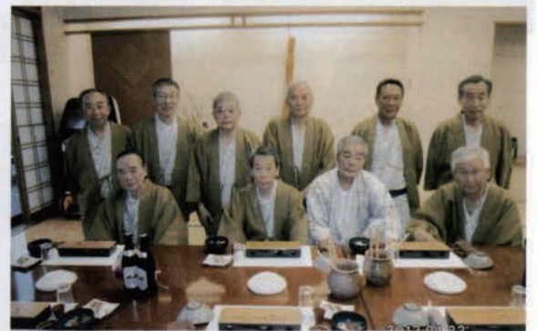
前列 左から 2番目 が私

昨年、今工百周年記念行事に出席して、大変感銘を受けました。開催に向けて努力された関係者の皆さまに感謝申し上げます。今後も今工卒業生として微力ながら協力してまいりたいと思います。