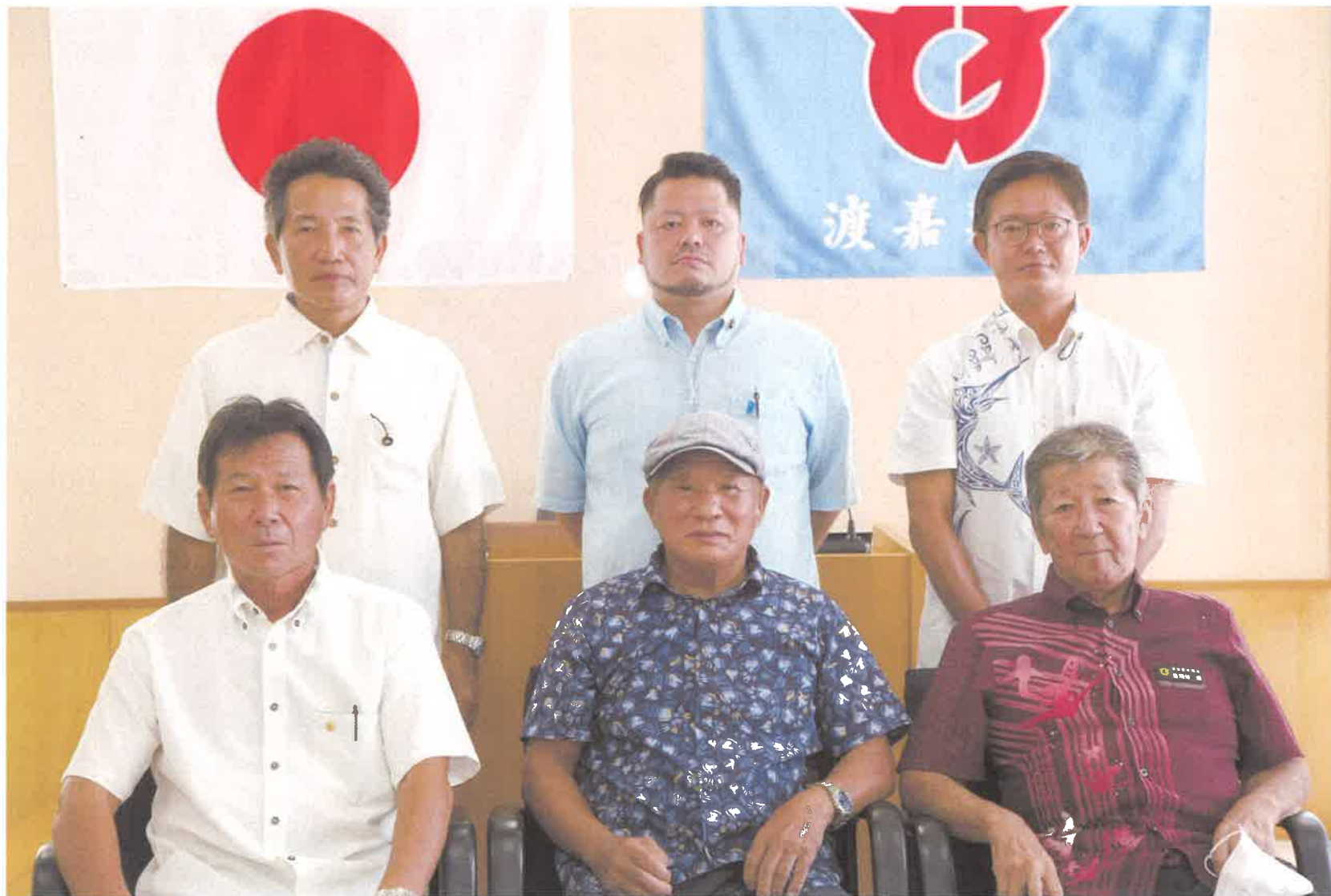
渡嘉敷村議会議員