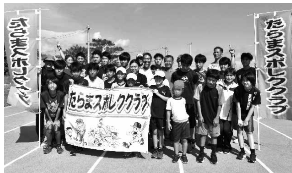
中学生・一般 集合写真