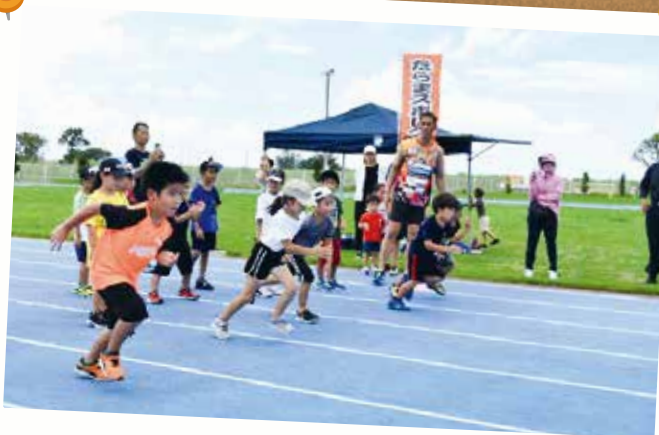
かけっこ教室・陸上教室 8月12日