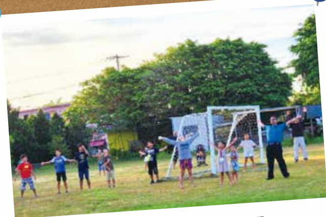
ラジオ体操中央大会 7月21日