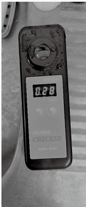
残塩チェッカーで塩素濃度を毎日チェックしています

道の担当となつて分かったことがあります。水道水には、細菌が発生するのを抑えるため、次亜塩素酸ナトリウム(カルキ)が含まれています。水道水で洗い流すことにより、傷口に細菌が発生するのを抑え、そして、自然治癒力でけがが治る。それが、傷口にとって一番良い治療なのだ、なるほどと納得しました。現在、消毒液を使うことは殆ど無くなりましたが、皆さんは如何ですか？