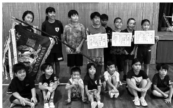
優勝した大木Aチーム

7月29日(土)、小学校体育館において多良間村子ども会育成連絡協議会主催のキックベースボール大会が行われた。各区子ども会から8チーム(土・天、津川A・B、嶺間、大道、大木A・B、吉川)の参加があった。ホームランでチームを引っ張ったり、仲間と連携したプレーで守備を固めたりと熱い戦いを繰り広げた。