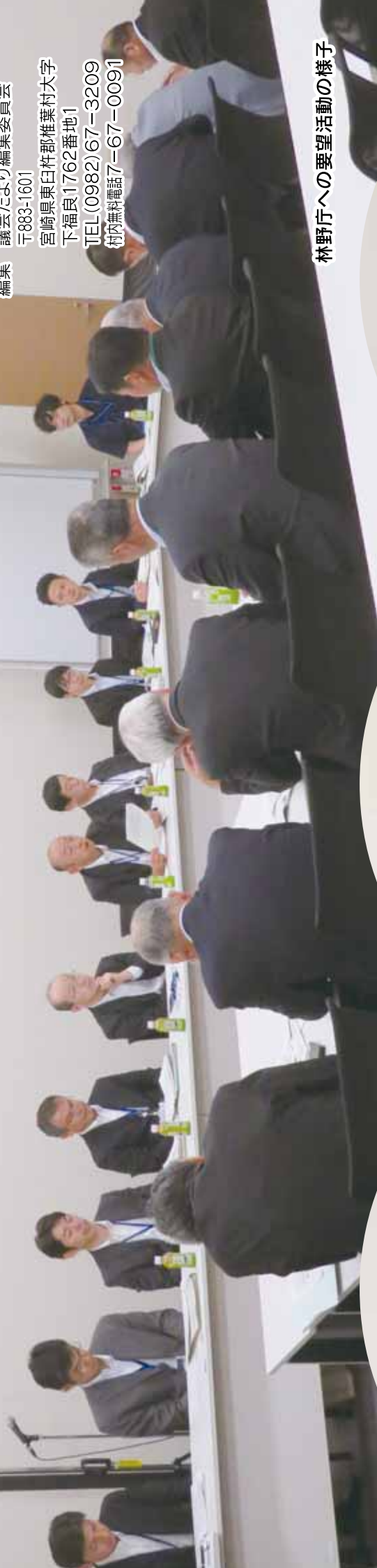
林野庁への要望活動の様子

宮崎県椎葉村議会 議会だより編集委員会 〒883-1601 宮崎県東臼杵郡椎葉村大字 下福良11762番地1 TEL (0982)67-3209 村内無料電話7-67-0091