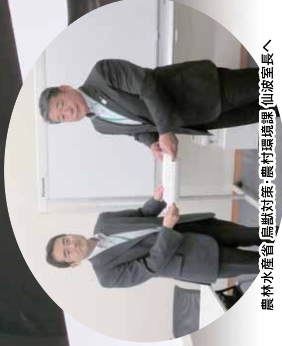
農林水産省 鳥獣対策・農村環境課 仙波室長へ