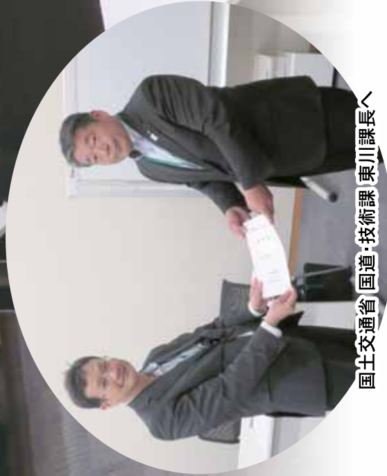
国土交通省 国道・技術課 東川課長へ