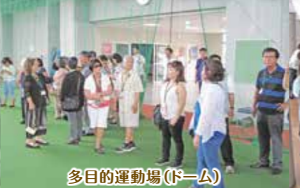
多目的運動場(ドーム)