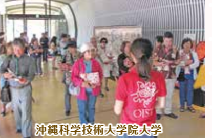
沖縄科学技術大学院大学