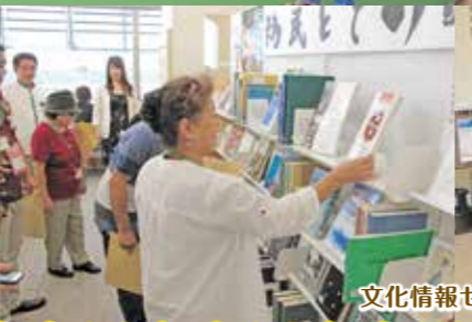
文化情報センター