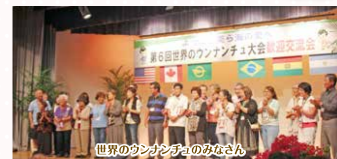
世界のウナンチュのみなさん

海外に移民し、恩納村にルーツを持つウナンチュを招いた「第6回世界のウナンチュ大会交流会」が10月29日、ホテルムーンビーチで行われました。歓迎交流会には来村した31名を含め約200人が参加しました。