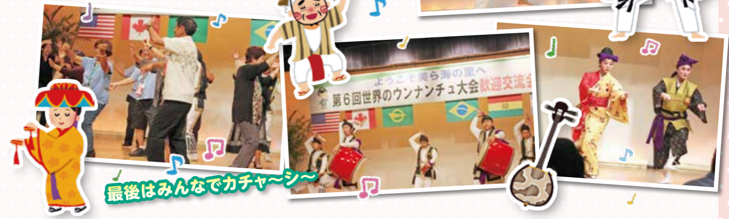
最後はみんなでカチャーシー