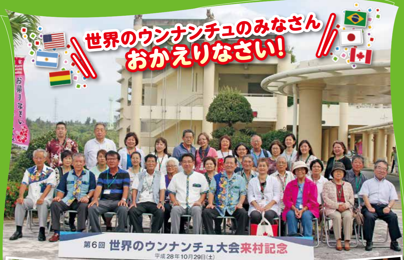
第6回 世界のウナンチュ大会来村記念 平成28年10月29日(土)