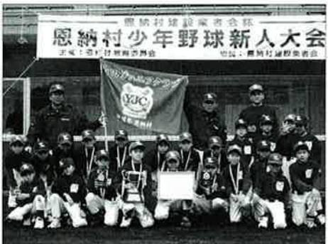
▲恩納村少年野球大会で二連覇を達成した山田ジュニアクラブ