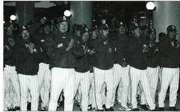
▲園児たちの演舞に拍手を送る三星ライオンズ

2月10日から3月10日までの日程で、韓国プロ野球団、三星ライオンズがONA赤間ボールパークでキャンプインしました。キャンプ初日の10日には、恩納村役場で歓迎式が行われ、恩納保育所園児たちが歓迎のダンスを披露しました。ソン・ドンヨル監督は「昨年続き、今年も恩納