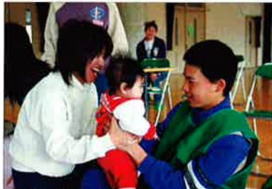
▼赤ちゃんの抱っこに挑戦する生徒