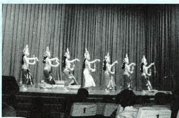
▲カンボジアの伝統的なダンス、アプサラダンス

ユニセフの資料によると、世界64億人のうち1日の生活を1ドル未満で送っている人は約12億人で、カンボジアの約38%はその中に入るといわれ、生活水準や教育など病気以外にも様々な問題を抱えています。お金が無いために学校へ行けない子や、家族の収入を支えるために家事や農業を手伝い十分に学校へ通えない子、また、学校の設備や教員の都合で半日しか授業をできないなど、教育制度が不十分で、その教育レベルの低さがまた病気に対する意識や知識にも影響してきます。