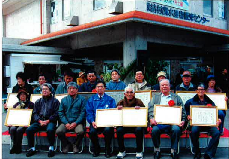
▲品評会で表彰された生産者のみなさん