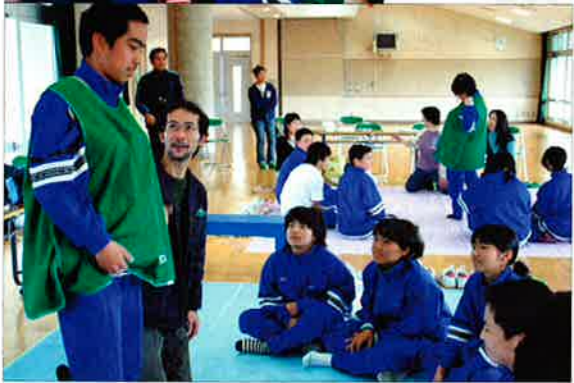
▲8キロのおもりをつけて妊婦体験をする生徒たち