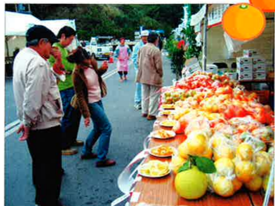
▲おいしいミカンの試食も楽しめる恩納村産業まつり

おんなの賑やかなゆくい市場で第8回恩納村産業まつりが12月17日、18日の両日開かれました。会場は恩納村の特産品を買い求める多くの来場者で賑わい、まつりを楽しんでいました。また、品評会では、各部門の優良賞や1位、2位の方々に表彰が行われました。