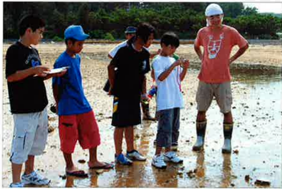
▲GPSとデジカメを使って生き物の記録をとる児童ら。