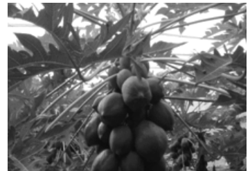
【問題の無いパパイヤ】