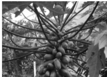
【未承認の遺伝子組換えと疑われるパパイヤ】

今後、庭先や道端で未承認遺伝子組換えパパイヤと疑われる株がありましたら、以下の連絡先まで情報提供下さい。