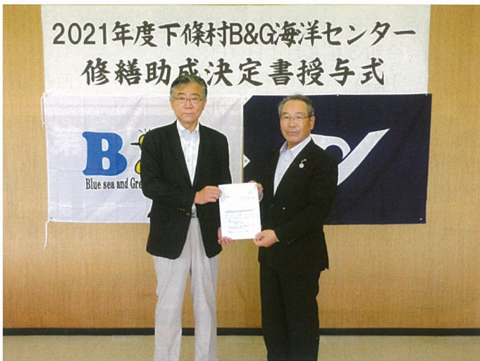
▲ 修繕助成決定書が手渡されました。

体育館は、昭和五十六年にB&G財団が建設し昭和六十年に下條村に無償譲渡されました。以来、多くの村内の皆様に利用されてきましたが、建築後四十年を経過し、雨漏りや床や壁の劣化が目立つようになってきました。改修後は、安全性と快適性を高め地域住民の健康・コミュニティづくりの拠点になるよう努めてまいります。