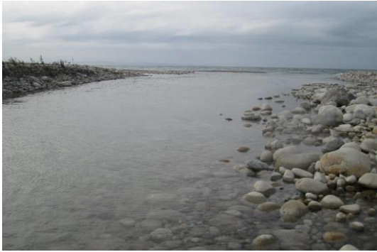
写真1 定点1：河口から早月橋