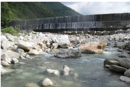
写真4 定点4：中村堰堤下