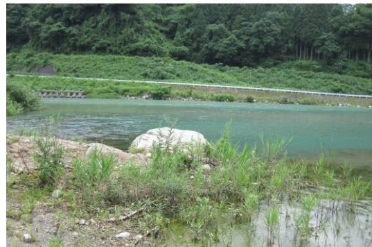
写真6 調査地点②：小早月川合流点