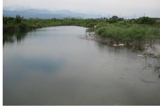
写真5 調査地点①：河口左岸の溜まり