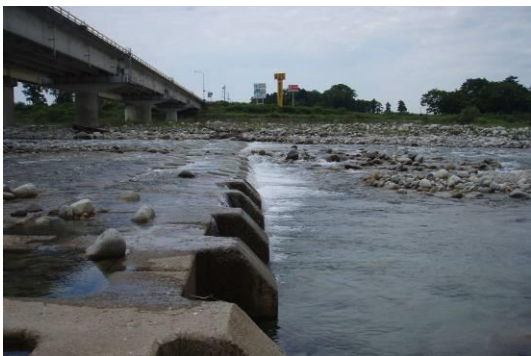
写真2 定点2：JR 早月大橋から早月大橋