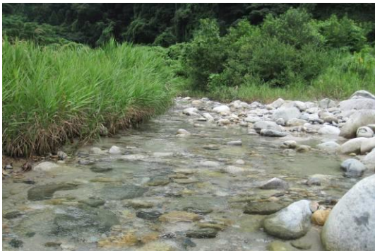
写真3 定点3：蓑輪堰堤上