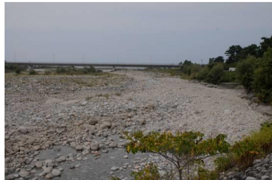
写真8 雨天時の下流部