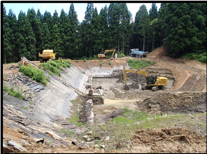
— ため池改修工事風景 —