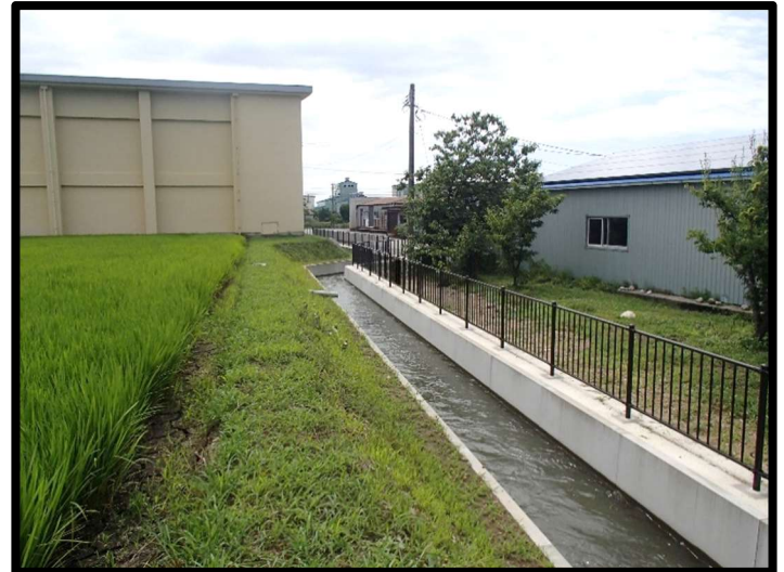
— 水路改修後の通水風景 —