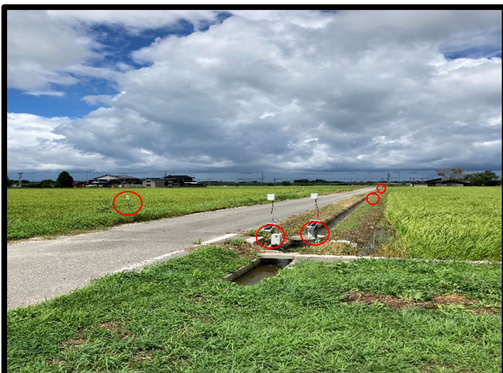
— ICT水口を活用中のほ場風景—