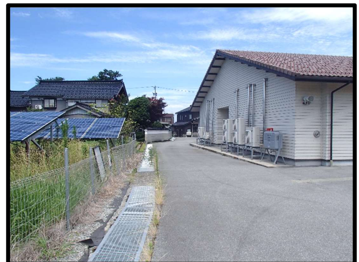
— 水路フタ掛け後風景 —