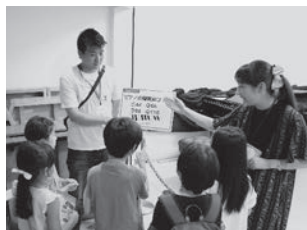
オープンハウス (案内)