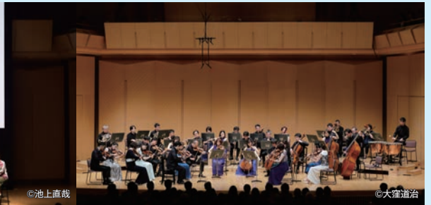
“晴れオケ”によるベートーヴェン・チクルス