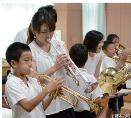
小学4年生対象のアウトリーチ

中央区およびその近隣地区の小学校や幼稚園・保育園などの教育機関や病院、介護施設など普段、生の芸術文化に触れる機会が少ないみなさまのところへ演奏家と伺い音楽をお届けするアウトリーチ活動をしています。音楽を鑑賞するだけでなく、演奏家とのコミュニケーションを重視して、訪問先の対象者や特色などに合わせたプログラムをお届けしています。