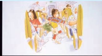
親子で楽しむ「音楽と絵本」