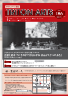
トリトンアーツ通信