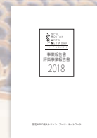
事業報告書&評価事業報告書