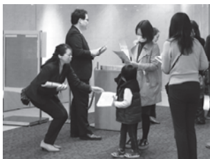
パンフレット配布

サポーターは通年募集をしています。まずはお気軽に、お電話 (TEL:03-3532-5701) またはホームページの [お問い合わせフォーム] からお問い合わせください。詳細は面談で、ご説明いたします。