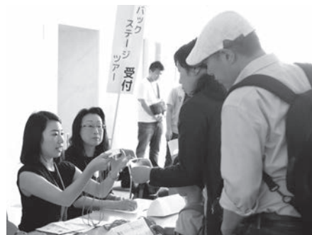
オープンハウス (受付)