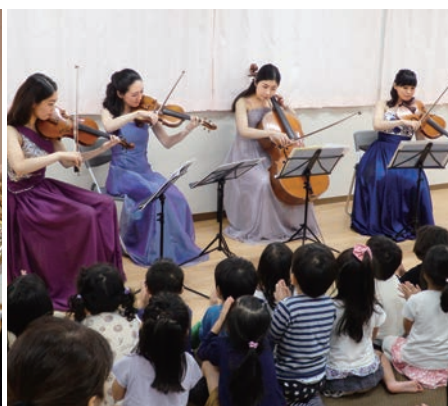
幼稚園・保育園でのアウトリーチ