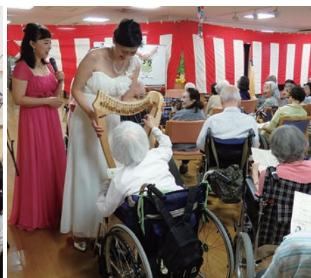
特別養護老人ホームでのアウトリーチ