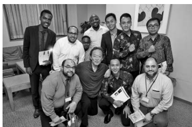
定期演奏会に来場のJICA東京研修生の皆様とチョン・ミョンフン(2019年7月東京オペラシティ定期)

東京フィルでは国際交流事業の一環として、海外からの留学生や研修員の方々を定期演奏会へご招待する「留学生招待シート」を設けており、皆様からご寄附いただいたチケットも有効に活用させていただきます。詳しくは東京フィルチケットサービス(03-5353-9522)までお問合せください。