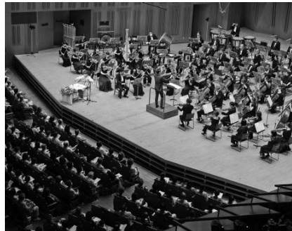
東京フィル副理事長でもあるユニセフ親善大使・女優の黒柳徹子。「最初は、第二次世界大戦で傷ついた人たちに元気を届けたいと思い始めたコンサートでした」と黒柳。若い人たちにも戦争の悲惨さを知ってほしいと話しました