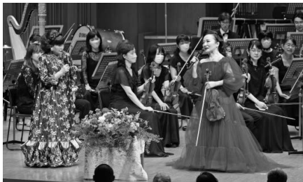
演奏活動60周年を迎えた前橋汀子さんが美しい音色で名曲を奏でました