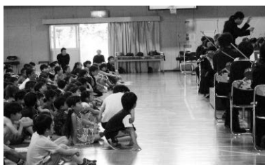
小学校体育館でのオーケストラ本公演

文化庁が主催する本事業は、日本全国の小中学校や特別支援学校を訪問し、一流の文化芸術団体による巡回公演を行っています。東京フィルは国内オーケストラでは唯一、文化庁から8年間の長期採択を受け(2014～2021年度)、東日本大震災地域を含む北海道・東北地区の小中学校115校、のべ46,279名の児童・生徒、地域の皆様と交流を行い、さらに2019年度からは、これに加え、関東・東海・中国地区の小中学校61校のべ20,389名の児童・生徒に音楽をお届けしました。