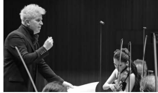
ソリストは気鋭のヴァイオリニスト服部百音さん。技巧と歌を存分に響かせ、トークでも客席を沸かせました