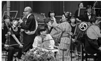
音楽物語『窓ぎわのトットちゃん』では東京フィルメンバーも仮装して活躍(「チンドン屋さん」)