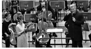
桂冠指揮者ダン・エッティンガーが3年ぶりの登場

【オーケストラ・アンコール】ロッシーニ／歌劇『ウィリア ム・テル』序曲より「スイス軍の行進」