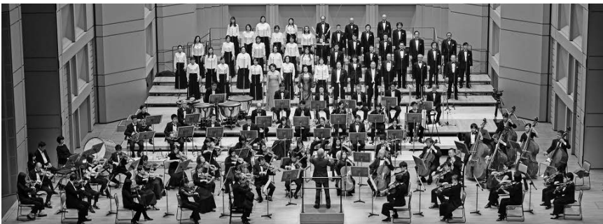
2020年の尾高忠明指揮『第九』特別演奏会より

問合せ 東京フィルチケットサービス 03-5353-9522 (10:00～18:00・土日祝休／9/3(土)、9/10(土)は10:00～16:00営業) 東京フィルWEBチケットサービス https://www.tpo.or.jp/ (24時間受付・座席選択可)