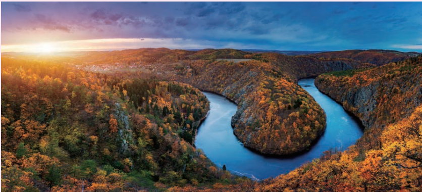
モルダウ（ヴルタヴァ）川の蛇行による神秘的な地形。チェコの代表的な絶景スポット「マーイの展望」

「モルダウ」とは、チェコの中西部を南北に流れる同国内最長の川の名前で（「モルダウ」はドイツ語で、チェコ語では「ヴルタヴァ」と呼びます）。ふたつの水源から流れ出した川が合流してひとつとなる様子が音楽で描写されます。冒頭、フルートが第一の源流を表現します。続いてクラリネットが表すのは第二の源流。ふたつの源流は重なり合い、小さな川の流れが次第に勢いを増して、川幅を広げます。哀愁を帯びた有名な民謡風主題は、雄大な川の流れを連想させます。川は森を抜けて、人々の暮らす村へ。ホルンを中心とする金管楽器が狩を連想させ、続いて歯切れのよいリズムで結婚式の村人たちの踊りが表されます。夜の訪れとともに曲調は幻想的に変化します。月明かりのもとで踊るのは水の精。やがて民謡風主題が回帰し、急流を経て、クライマックスを築きます。最後は川が視界から遠ざかってゆくかのようなようです。