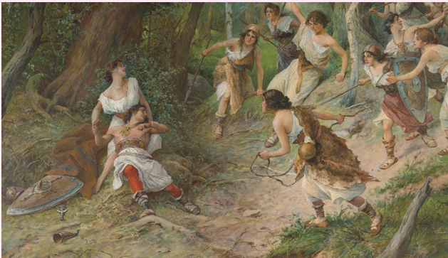
シャルカがツチラトを畏にはめた場面を描いた絵画 (ヴェンツェスラフ・チェルニー作)

「シャルカ」とはチェコの伝説に登場する女傑の名前。この伝説では男たちと女たちが敵対しています。曲の冒頭が勇ましい曲調なのは、シャルカの気性の激しさゆえ。しばらくすると、行進曲とともに英雄ツチラト率いる男たちの兵がやってきます。シャルカは仲間に自分の体を木に縛り付けさせて、通りかかったツチラトに助けてほしいと懇願します。優美なクラリネットがシャルカを、チェロがツチラトを表現します。ロマンティックな音楽が奏でられ、ツチラ