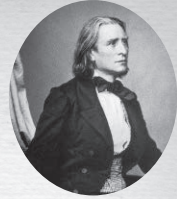
1858年頃の フランツ・リスト

リストのピアノイズムを交響楽の語彙に編曲するための音色の調合についても同様である。文献学、書かれた記号、そして原典への忠実さを非常に重視している今日の音楽界において、この作品が国語純化論者たちの気分をあまり損なうことなく、過去の偉大なる作曲家への心からの捧げものとして居場所を見つけられるよう願っている。