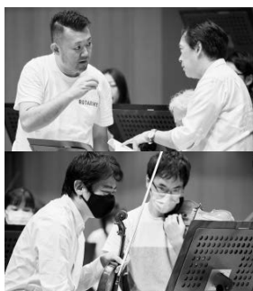
メンバー同士もアンサンブルの打合せを重ねます