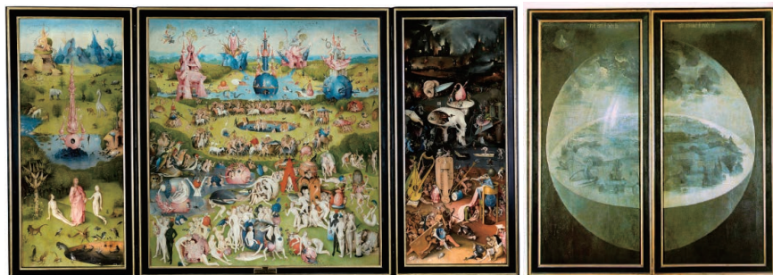
ヒエロニムス・ボス『快楽の園』(The Garden of Delights, 1503-1504, フラド美術館蔵)