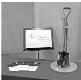
スコープに込められた「一緒に深いところにある音を掘り起こそう」という言葉とともに、公演会場ロビーでも展示しました