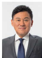
東京フィルハーモニー交響楽団 理事長 三木谷 浩史

寒さもしだいにのり、吹く風にも秋色の濃さを感じる頃、 皆様におかれましてはご健勝のことと存じます。 今回は、マエストロの名曲にまつわるお話とともに、 楽団の奏でる音楽を心ゆくまでお楽しみください。 引き続き、当楽団を何卒よろしくお願ひ申し上げます。