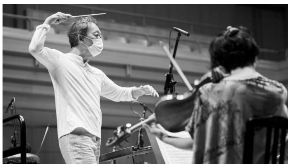
東京オペラシティコンサートホールでのリハーサルより

ブラームス／交響曲第3番 へ長調 Op. 90 ブラームス／交響曲第4番 ホ短調 Op. 98