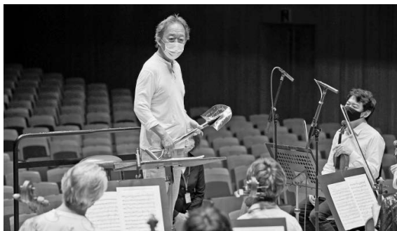
リハーサル初日、マエストロから20年前に東京フィルに贈られた「スコープ」があらためて披露されました