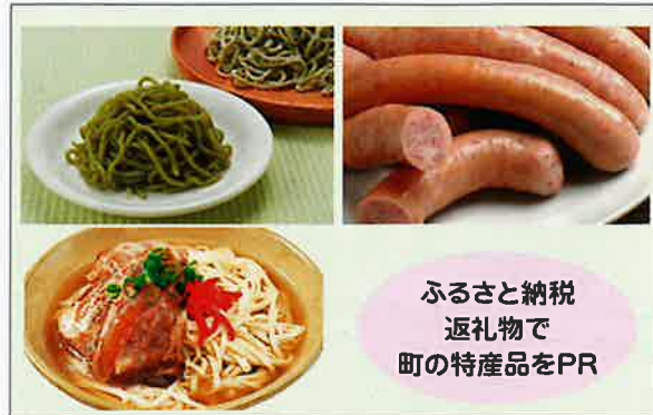
ふるさと納税返礼品で町の特産品をPR