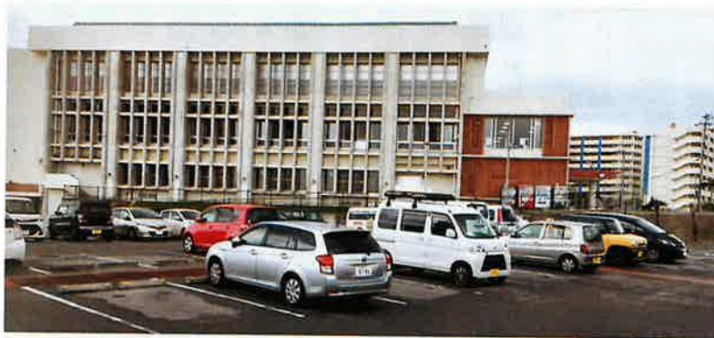
観光交流施設駐車場を有料化して夜も利用可能へ

質問 ネーミングライツで財源確保をする考えがあるのか。例えば公衆トイレ、公園のあずま