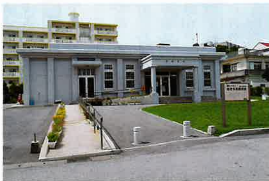
軽便与那原駅舎展示資料館