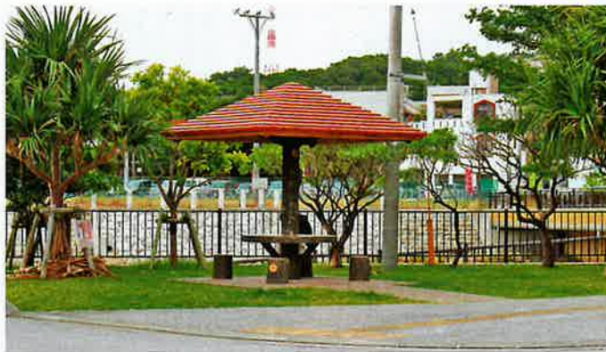
安全防止のために定期的に点検を

化、腐食など打診や目視で点検を行っており、必要に応じて補修しており、今後は建築士、建築施工管理技士などによる点検も検討していく。