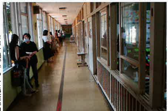
コロナ禍で行われた授業参観

い日々を送っており、一部の中には心の健康の維持に苦慮している。体力の低下も指摘されて、小中学校では担任、学年主任、養護教諭、教育相談担当、スクールカウンセラーとチームで対応する体制を整え、子どもたちの心の健康、心のケアに務めている。教育委員会は各学校と連携を図り、児童生徒の学習保障に向けカリキュラムマネジメントに取り組み、新しい生活様式の下、学校や日常生活における対策と対応に全力を尽くす。