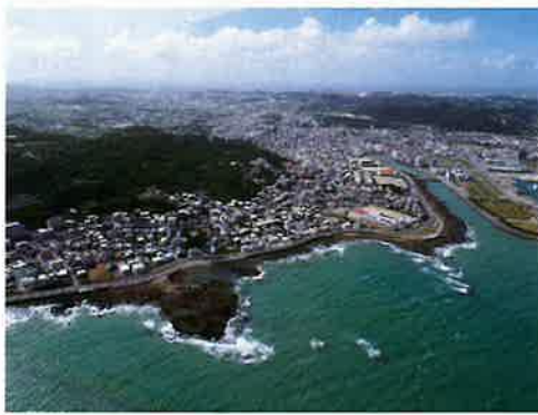
移住したい街 与那原町が上位にランキング

づけでは人口増加率や治安、買い物や子育てなどの項目を基に分析されている。東浜地区の住宅や集合住宅の開発が進み、県内外から移住者が増えたこと。また歩いて行ける範囲内に銀行、病院、食品スーパー、保育園、小中学校、公園等が充実していることや治安を守る警察や消防署が身近にあることなどが考えられる。