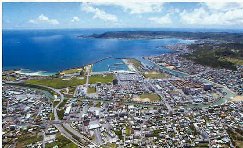
マリンタウン東浜（平成29年）

り破壊されたものであり、その復元は戦後補償の一環として国の責任で解決し、LRTまたはBRT等の新たな公共交通機関の導入で交通渋滞の解決やまちづくりを生かすようにすべきだと思いが。