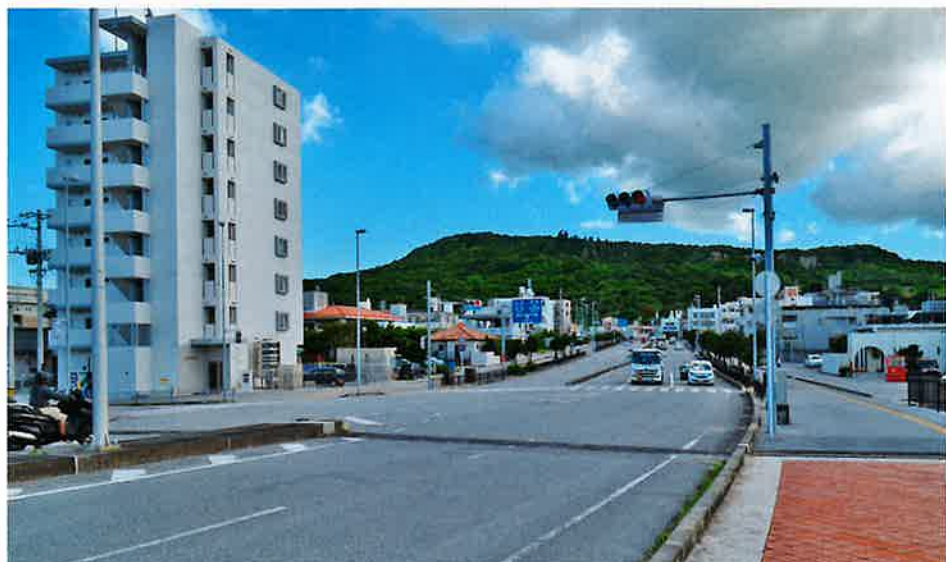
今後の道路整備が問われる「県道77号 与那原系満線」

の選定は非常に重要なことで、事前に南城市ともすり合わせをしながら我が町の土地利用計画に一番よいルートを選定していくことが重要である。事前に3案を見ながらどのルートが町としていいか、町長、まちづくり課と議論し、県との協議