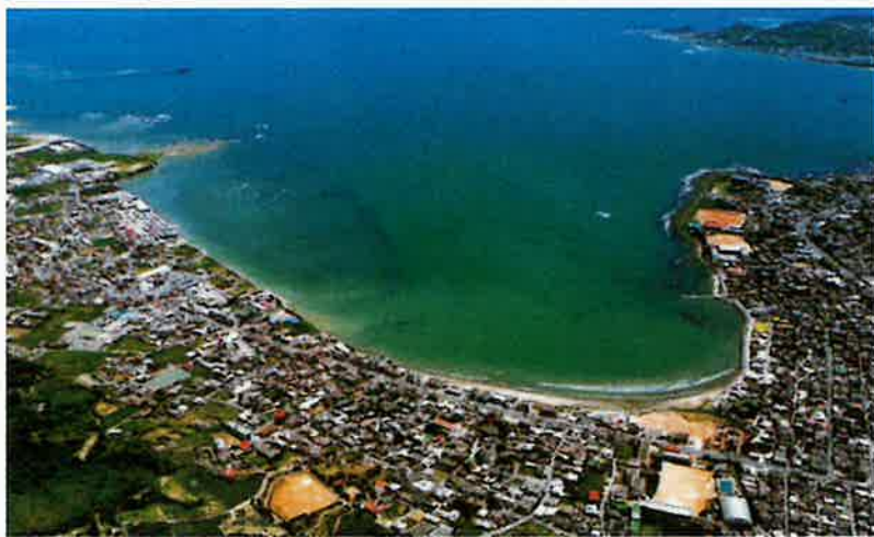
マリンタウン東浜（平成8年）