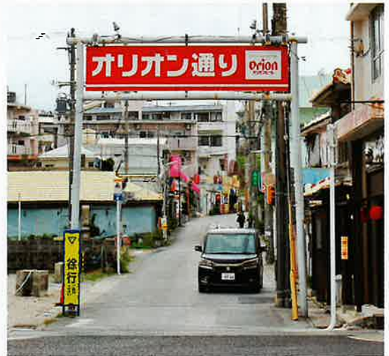
オリオン通りの電柱移設で道路拡張を