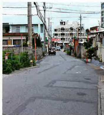
拡張予定のオリオン通り