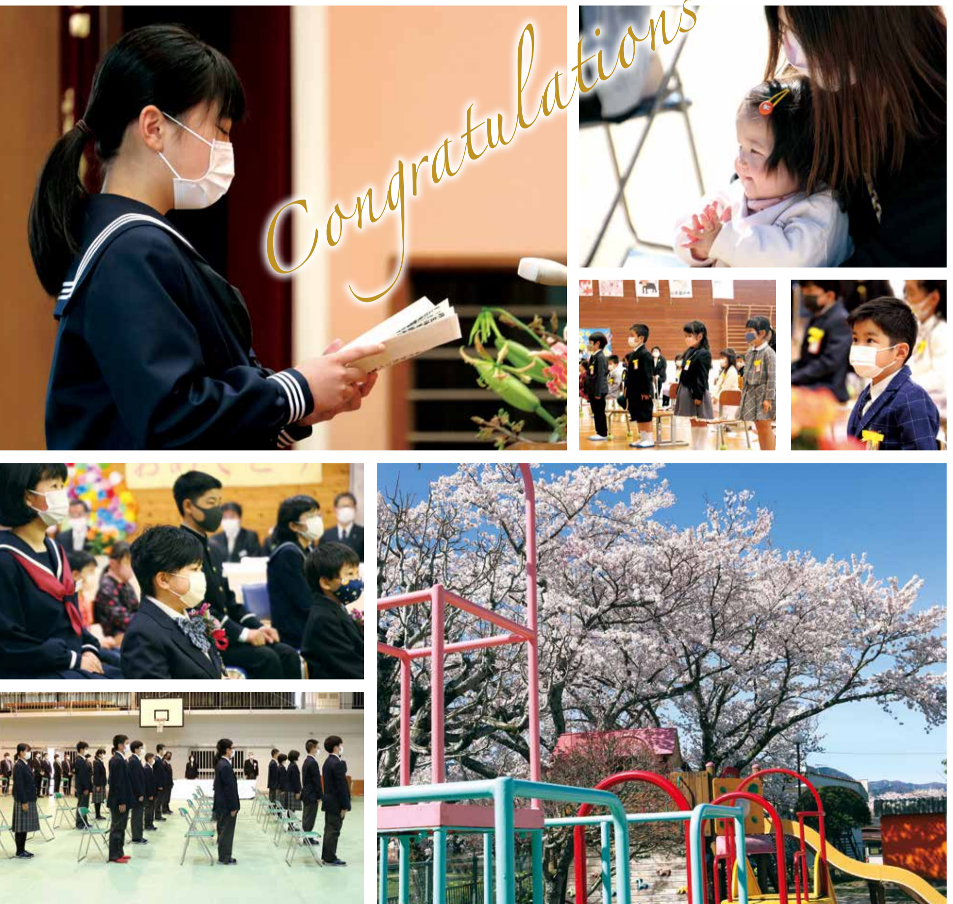
4月吉日、町内各所で入学式、入園式が行われた