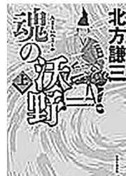
著 北方 謙三

死ぬまでは前を見て生きろ！加賀の地に燃え広がる一向一揆の炎。 蓮如、富樫政親との奇縁から、闘いに身を投じたある若き侍を描く、血潮たぎる歴史巨編。