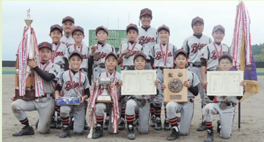
▲優勝 石塚ビックス