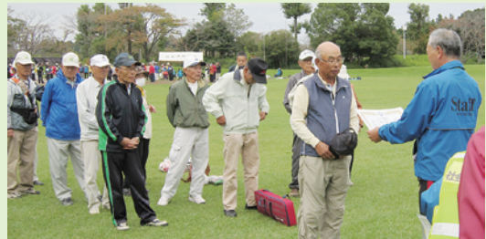
▲クロッケーの部 優勝 磯野長生会チーム

町からは全5種目に出場し、クロッケーの部で磯野長生会チームが優勝、ペタンクの部で阿波山チームが準優勝しました。