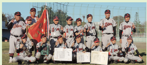
▲創部以来初の県大会優勝 石塚ビックス