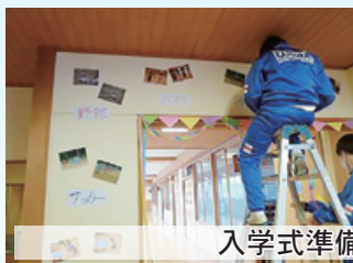
入学式準備・飾り付け