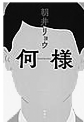
著 朝井 リョウ