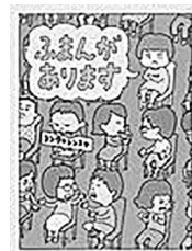
作・絵 ヨシタケ シンスケ

どうして、子どもだけはやく寝なくちゃいけないの？どうして弟が悪いの？わたしはやっぱり文句をいって、ズルいのをやめてもらおう！ ヨシタケシンスケのユーモア絵本。