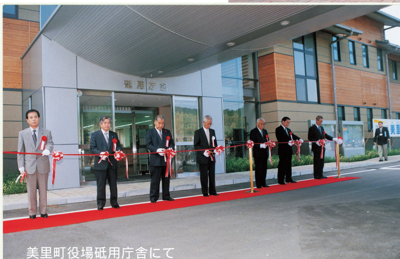
美里町役場砥用庁舎にて