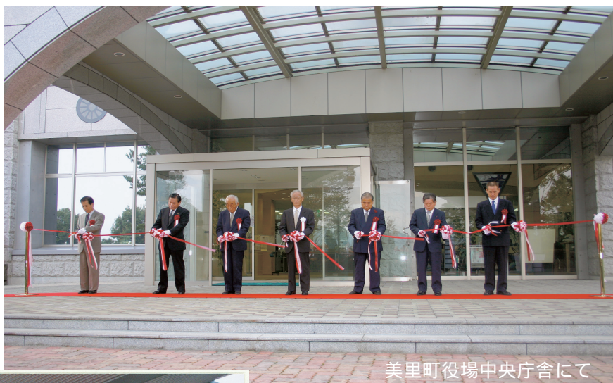
美里町役場中央庁舎にて