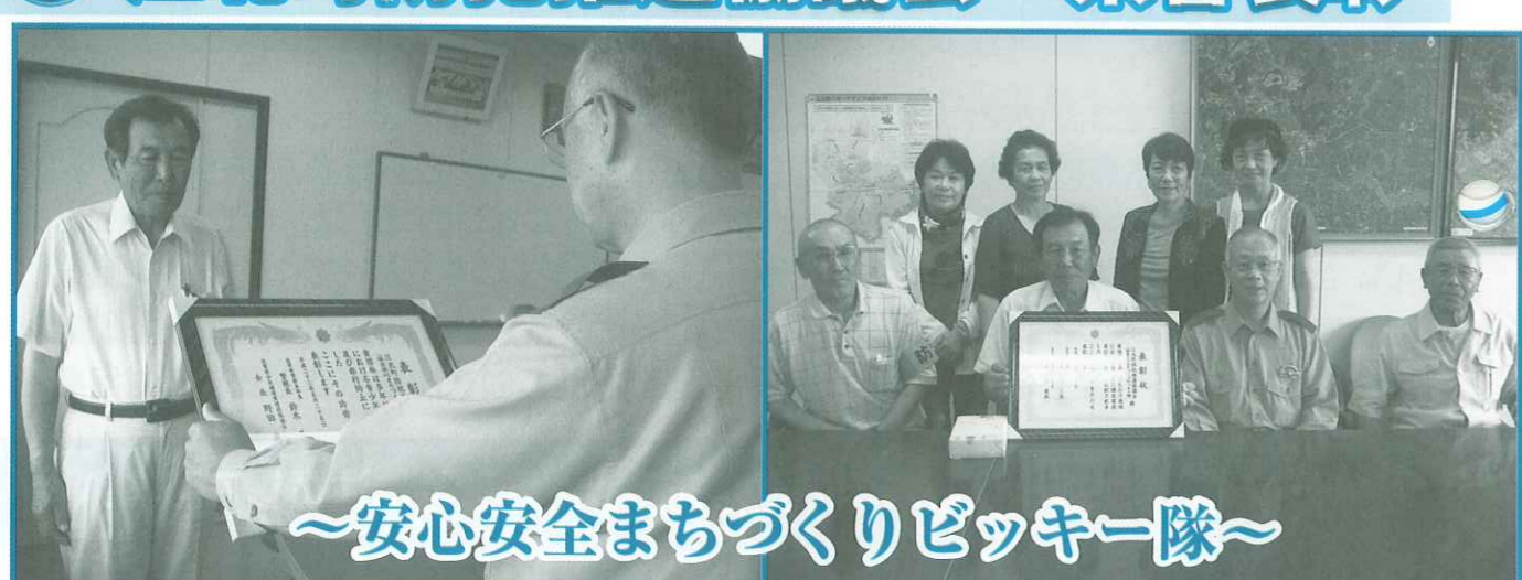
～安心安全まちづくりビッキー隊～

6月17日(木)、江北町防犯推進協議会が地域における青少年の健全育成及び非行防止に貢献された功労をたたえられて、佐賀県警及び県少年補導員連絡協議会から表彰状が贈られました。 江北町防犯推進協議会、通称ビッキー隊は、平成14年に発足以来、8年間、地域の青少年健全育成及び非行防止活動を通し、地域ボランティアとして安心安全まちづくりに貢献されています。 会員は現在42名で、学校の春季休業、夏季休業、冬季休業中は毎週3日、その他の月は、月3回の街頭パトロールに取り組みされています。 子どもが凶悪犯罪に巻き込まれる事件が多発している中、こうした方々のボランティア精神にもとづいた活動に、子を持つ親はもろろんのこと、町もとても支えられています。 ビッキー隊の方々の継続は力なりには本当に感謝のひと言です。 熟高齢者の率先した地域活動が地域福祉の向上につながっていることは、いまでもありません。 これからもシニアパワーを存分に発揮して町を守ってくださいね!