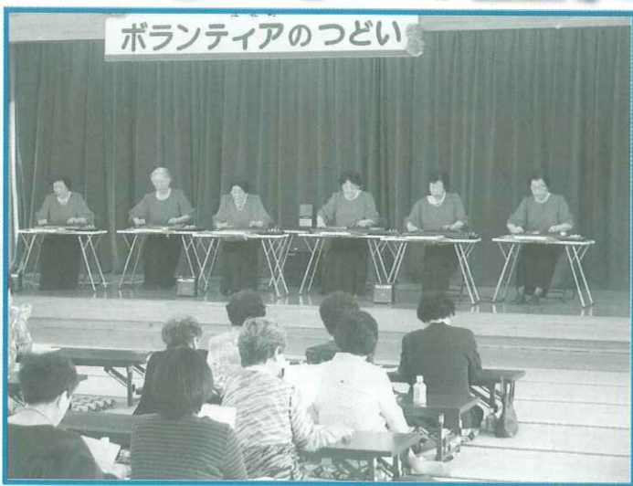
ボランティアのつどい