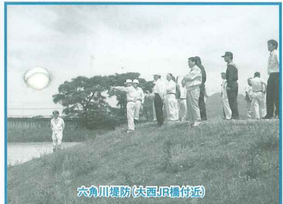
六角川堤防(夫西JR橋付近)