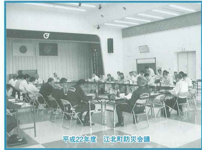
平成22年度 江北町防災会議

さて、「もし災害が起こったら」と仮定して、事前の準備等をされているご家庭はどれくらいあるでしょうか。 災害には、大きく地震、風水、土砂災害がありますが、災害に備えようと思ったとき、一体何から準備すればよいのかご存知ですか? いざという時に備えて、まずは、生命の危機を軽減するもの、自宅内での避難を手助けするもの、避難所で健康を維持するために必要なもの、避難生活を快適に過ごすために必要なものの順だそうです。 大規模な災害が発生してライフラインが止まり公的支援が行渡るまでに家族の生命、健康を維持するためには、飲料水、非常食、医薬品、衣類、停電時用品、避難所への持ち込みグッズ、緊急時の避難、救助用品、貴重品等の準備が必要です。 これらを準備するのは大変ですが、まずは意識を高め、安全対策について知ることから始めましょう。 最後に、六角川堤防高上げ工事箇所のパトロールを行い「防災」に対する決意を新たに、防災会議を閉会しました。 6月10日(木)に江北町公民館3階ホールにおいて、江北町防災会議が開催されました。 まず、防災会議委員に対して委嘱状が交付され、その後、建設課長から江北町の監視箇所の実態・地すべり対策やその他重要防水区域について説明があり、次に、水害が発生した場合の町の対応等について、平成22年度江北町水防計画書に基づき説明が行なわれ、各種防災対策について協議が行なわれました。 また、武雄河川事務所朝日出張所長から昨年7月の大雨の状況と六角川の築堤改修工事の進捗状況報告がありました。