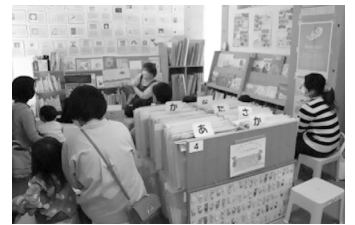
4月のおはなし会の様子