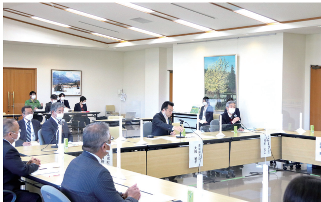
当日は大岡環境副大臣が来庁され、地元企業の方などと環境政策について意見交換されました