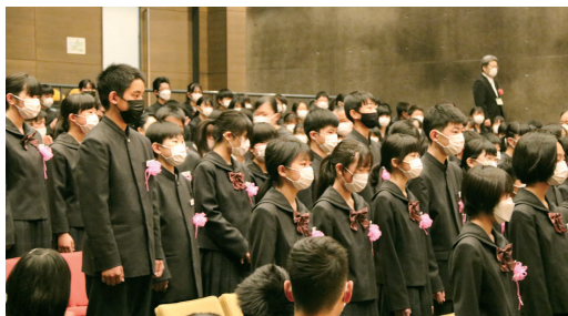
ここのえ緑陽中学校

町内こども園・小学校・中学校の入園式・入学式が行われ、新入園児・新入学生が新しい生活をスタートさせました。