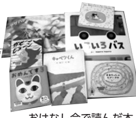
おはなし会で読んだ本