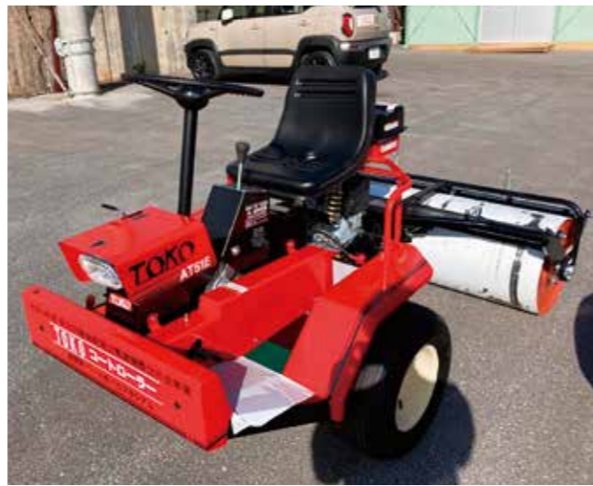
▲ 購入したグラウンドローラー