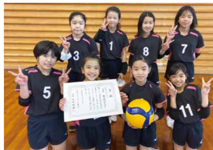
▲ 優勝した金武小学校女子バレーボールクラブ

3月5日から6日、本部町体育館で第28回島袋杯小学生バレーボール大会(5年生以下の部)が行われ、金武小学校女子バレーボールクラブが優勝しました。