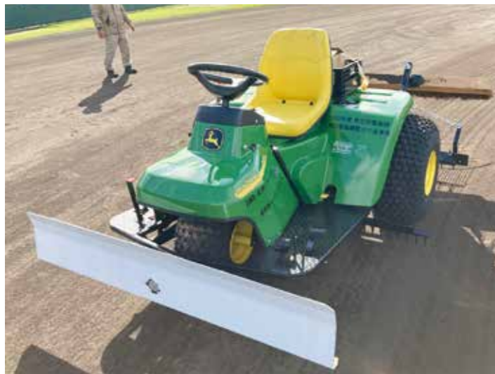
▲ 購入したスポーツレイキ