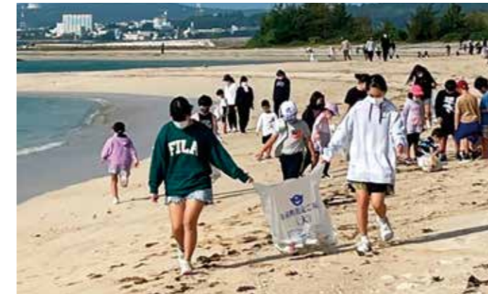
▲東から西まで清掃活動

また、清掃後には、子どもたちと一緒に参加した保護者も一緒にドッジボール大会を実施し、楽しい子ども会活動になりました。