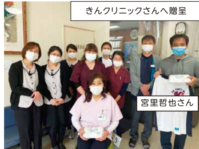
きんクリニックさんへ贈呈