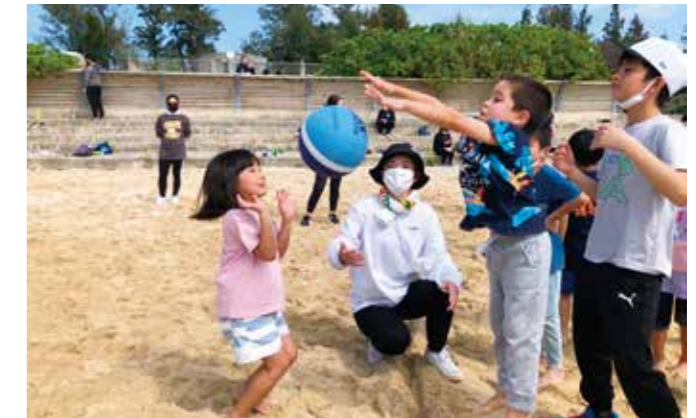
▲清掃後のドッジボール大会♪