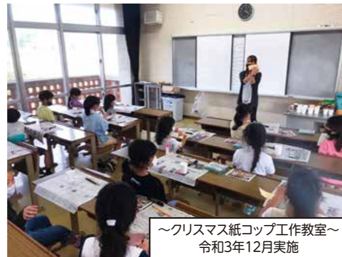
～クリスマス紙コップ工作教室～ 令和3年12月実施

※新型コロナウイルス感染拡大の状況によっては、当該教室が延期や中止になる場合があります。