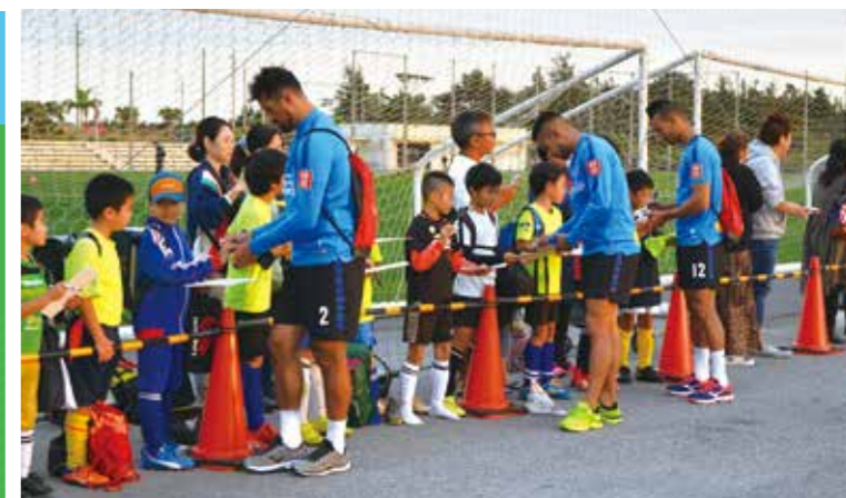
好きな選手からサインももらいました