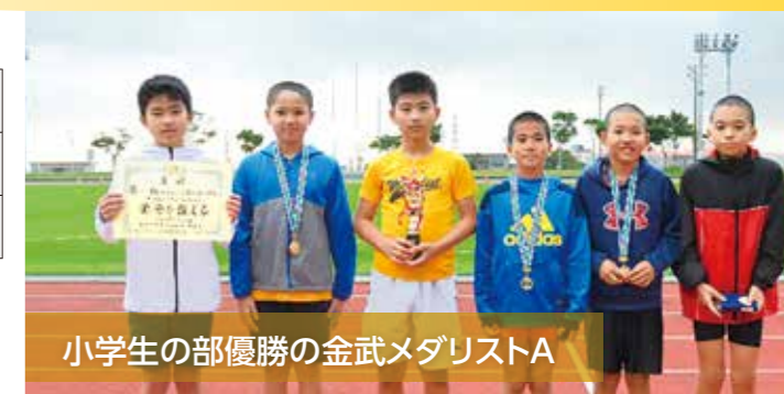
小学生の部優勝の金武メダリストA