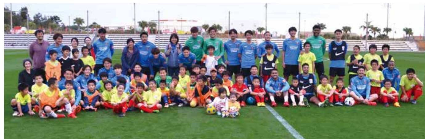
浦和レッズの皆さんと交流しました