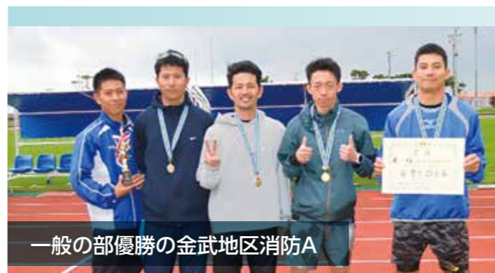
一般の部優勝の金武地区消防A