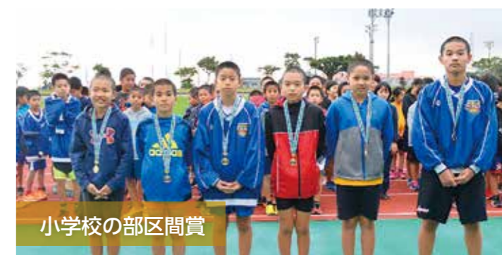
小学校の部区間賞