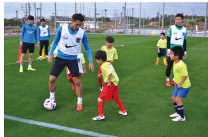
プロの選手に果敢に挑んでいました

サッカー教室終了後は、各選手帰り際にサインの対応もあり、子どもたちは喜び目を輝かせていました。