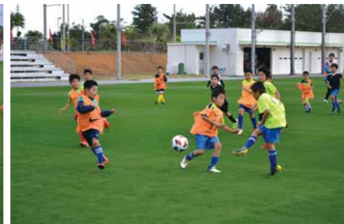
「上手だね!」と言われました