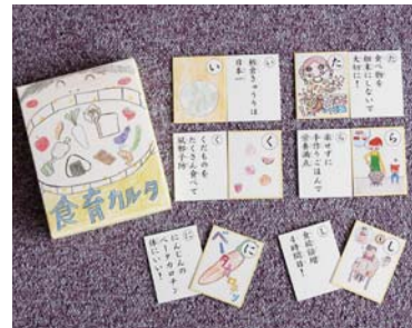
西小学校版「食育かるた」を作り、正しい食習慣の形成に力を注いでいる