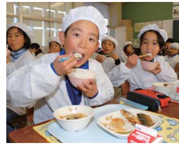
米作りが盛んなことから自校炊飯方式を取り入れ、週3回の米飯給食

地産の考えに立ち、地元農家で生産している安全安心な食材を中心とした自校給食を続けていることや、生産者・調理者への感謝の気持ちを持つて、バランスの取れた食事を規則正しく食べるなどの食育