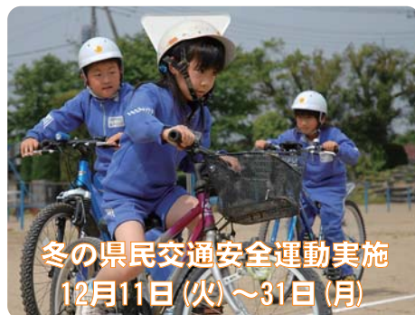
冬の県民交通安全運動実施 12月11日(火)～31日(月)

平成20年4月、後期高齢者医療制度がスタートします。何がかわるの? 「保険証」が変わります。 保険者は市町村? 保険者は群馬県広域連合です。市町村の役割は? 町の役割はみなさんの窓口。保険料の納付先も町です。だれでも加入できるの? 75歳以上のかたは全員加入。65歳以上の一定以上の障害をお持ちのかたは申請によって加入することが出来ます。なお、現在「老人保健受給者証」をお持ちのかたは全員が「後期高齢者医療制度」に移ります。 問合せ 健康介護グループ ☎内線326