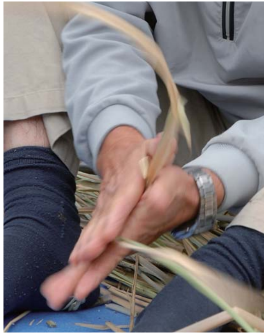
4本のマコモを絡めながら、縄を作ります。 経験のない人にとってはとても難しい技です。