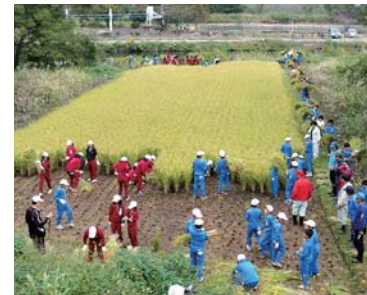
米作りなどの体験活動を通して、生産者への感謝の気持ちを育てている

指導が長年に渡り行われていること、また子どもたちが米作りや野菜栽培などの様々な体験活動を実践していることが評価されました。 この学校給食への取り組みの一部を写真で紹介しています。