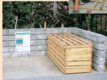
生ごみ用ごみ箱で カラスを排除！

第31行政区では、ごみステーションの生ごみがカラスに荒らされる被害が続く、それを解決すべく、カラスから完全にシャットアウトできる「生ごみ用ごみ箱」を住民自らの手で制作しました。