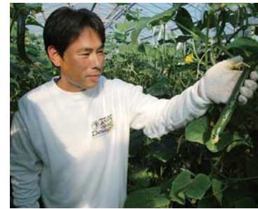
地産地消の考えに立ち、安全で安心な農産物が地元農家から届けられる