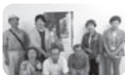
映画大使の皆さん

応募で選ばれた参加者が、映画大使として新作や話題の映画を鑑賞。その映画の意見や感想を話し合う生涯学習です。「ひので映画大使」は登録制です。開催日の一週間前に年別に抽選で大使を決定し、参加者に開催の日時・作品詳細をお知らせします。詳しくは、町のホームページをご覧ください。