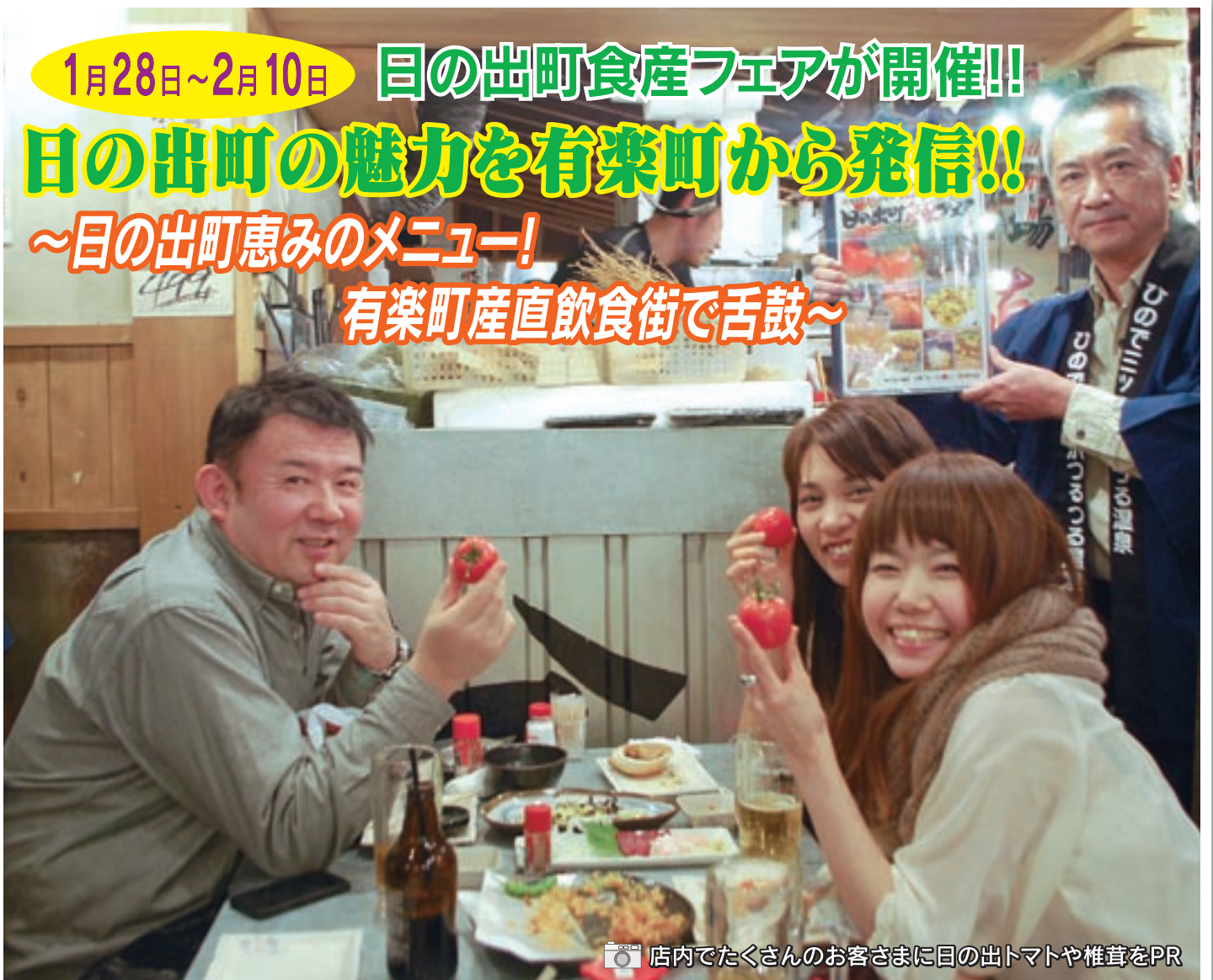
店内でたくさんのお客さまに日の出トマトや椎茸をPR