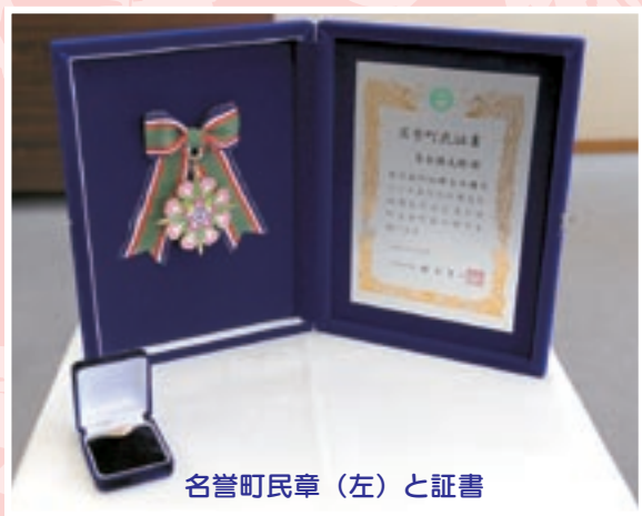
名誉町民章(左)と証書