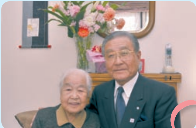
原さんのご自宅にて撮影