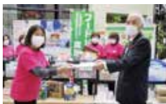
朝日町食生活改善推進連絡協議会様からのご寄附