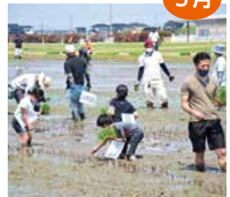
3年ぶりにみんなで田んぼアート