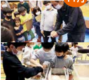
みんななび親子体験説明会

住民同士の学びあいの場を提供するプラットフォーム「みんななび」がスタートしました。