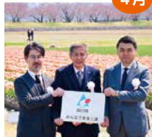
「みんなで未来！課」官民連携発足式

あさひ舟川「春の四重奏」臨時駐車場で行われた同式では、(株)博報堂とともに情報発信に特化し、住民目線のDXと再生可能エネルギーへの取組の推進を表明しました。