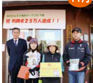
パークゴルフ場利用者25万人達成

記念したセレモニーが行われ、25万人目とその前後の利用者3人に記念品が贈呈されました。