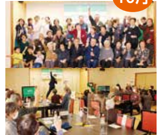
ノックルあさひまち本格運行から1周年

1周年記念イベントが、らくち〜ので開催され、参加した利用者らがステージイベントで盛り上がりました。