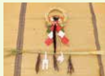
しめ縄&しめ飾りづくり体験に参加しました

▼新年明けましておめでとうございます。思えば昨年の4月から広報担当となり、取材に紙面づくりなどの新たな経験を積み、ここまで本当にあつたという間だったというのが率直な感想です。2022年、本当いろいろな出来事がありましたね。さて、過去を話すのはここまでで次は未来の話▼今年の干支は「卯(うさぎ)」です。その跳躍する姿から「飛躍」や「向上」を象徴し、景気が良くなることとされているそうです。近年の不景気もこれで回復傾向に向かうとよいですね。ちなみに皆さんはどんな年になりたいですか？広報担当としては、皆さんに昨年よりも「向上」した内容の紙面をお届けできるように努めてまいりたいと思っております。本年もどうぞよろしくお願いたします。