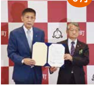
「ゼロカーボンシティ」宣言を表明

「オール朝日町」で地球温暖化対策に取り組み、2050年までに二酸化炭素排出量実質ゼロを目指すことを宣言しました。