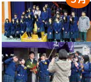
泊高等学校最後の卒業式&閉校式

閉校式では卒業生が見守る中、泊高校の本波校長から入善高校の川原校長へと校旗が引き継がれました。