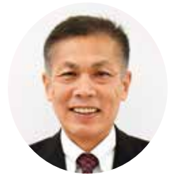
朝日町長 筈原 靖直