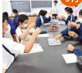
町内の小学6年生による中学校体験入学