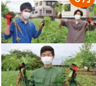
農業体験インターンシップ

東京農業大学の学生3人が、野菜の収穫やスマート農業などを体験し、「現場」における農業を楽しく学びました。