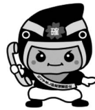
カクニンジャー福くん