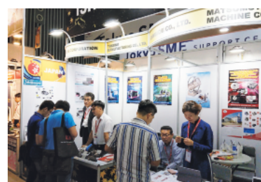
METALEX VIETNAM 2019の様子

今年度はベトナム・ホーチミンで開催される工業見本市 METALEX VIETNAM 2021（会期：10月7日～9日）と中国・上海で開催される FBC 上海 2021 ものづくり商談会（会期：10月26日～29日）に協会ブースを出展します。今回はリアル出展に加えて、渡航できないことを想定して、リモート出展での参加を可能としました。北國銀行ベトナム駐在員事務所などに現地サポートを依頼し、海外販路開拓の新しい形を提案します。