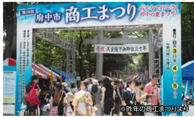
※昨年の商工まつりより

8月9日(金)～11日(日)午前10時～午後7時、大國魂神社境内及び、けやき並木の一部(11日)にて商工まつりを開催いたします。 会場では、見て・食べて・楽しく遊べるコーナーや、市内商工業者による多数の出展のほか、様々なアトラクションなど、楽しいイベント盛り沢山で開催いたします。府中を元気にする夏のイベント「商工まつり」に、ぜひお越しください。 即売コーナー(参道両側) 日用雑貨、食品、お酒、鉢植えなどの販売をしています。 展示コーナー(ふるさと府中歴史館北側スペース) 地元企業の商品や製品、住宅関連品の展示をしており、出展ブースではゲームなどのイベントを行っています。 自動車展示コーナー(大鳥居西側から稲荷神社南側) バイク、セニアカー、各種関連グッズの展示販売をしています。 相談・PRコーナー(ふるさと府中歴史館周辺) 行政機関や業種団体、企業などが事業PRやパネル展示、ゲームのほか、各種相談をお受けしています。 お祭り広場&味コーナー(結婚式場近くから相模場周辺) お祭り広場特設ステージでは、騎士電隊リュウソウジャーショーや、ミス府中コンテスト、ラッキー抽せん会、和太鼓演奏、サンパカニバルなど、子供から大人まで楽しめるステージが盛り沢山です。 ちびっ子広場コーナー(大國魂神社駐車場) ちびっ子広場では大人気のミニSSLが走ります。また各種飲食店のほか、楽しいイベントとして、騎士電隊リュウソウジャーのサイン会・写真撮影 会、各出展ブースのゲーム大会などを開催し、子供たちが楽しく遊べる広場です。 ワンデーイベント in けやき並木(11日) 11日、けやき並木にて、こども向けの職業体験や、チャダンス、サンパカニバルなど、様々な楽しいイベントが行われます。