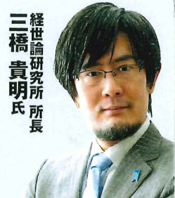
経世論研究所 所長 三橋 貴明氏