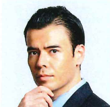
投資系YouTuber 高橋ダン氏

65万部のビジネス書「人は話し方が9割」の著者。一流人材を集めるのではなく今いる人間を一流にする人材育成法に定評。斎藤一人氏が「私が全てを教えたい青年に出会った」と指名。知覧「ホテル館富屋食堂」特任館長などを兼務。