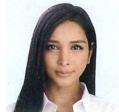
女優 サヘル・ローズ氏

慶應義塾大学大学院修士課程修了。三菱総合研究所を経て、2008年に米国ピッツバーグ大学経営大学院よりPh.D.を取得。NY州立大学バッファロー校ビジネススクール助教授。19年4月より現職。著書に「世界標準の経営理論」など多数。