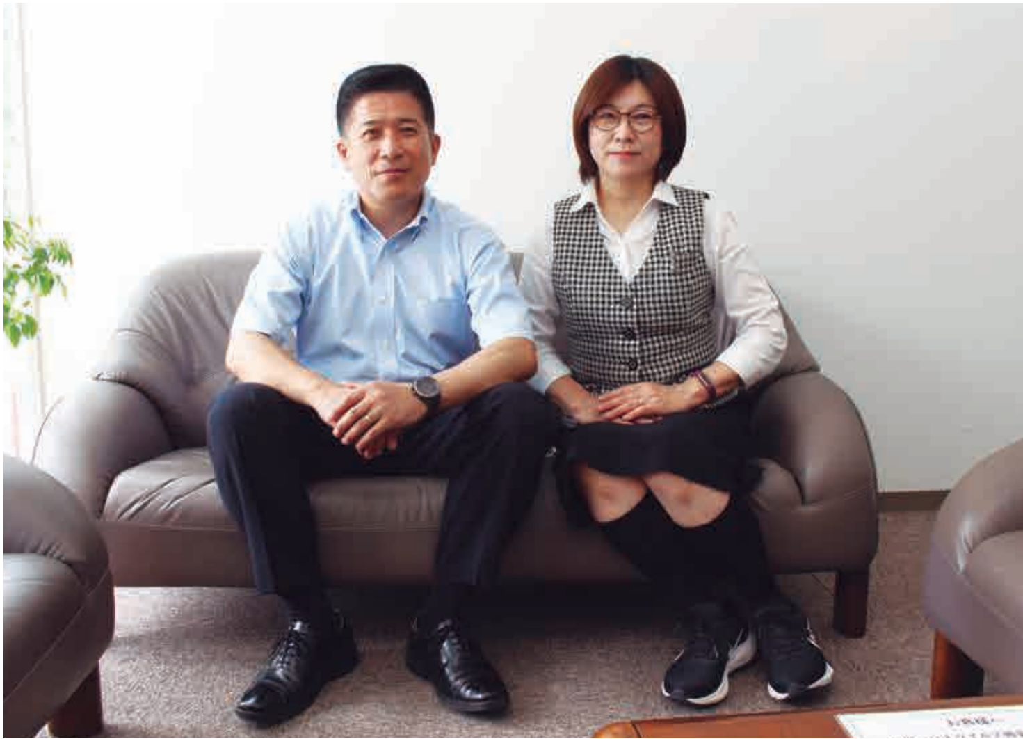
坂下津にある西部包装の一室でお話を伺った