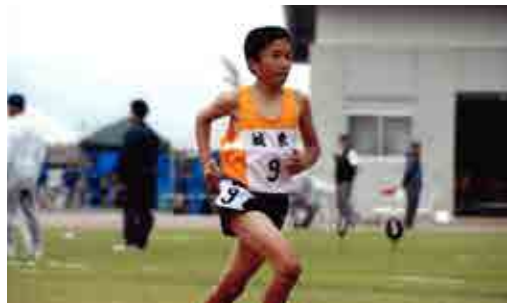
中学生時代の南予総体