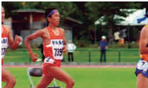
高校時代の南予総体