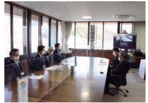
宇和島市役所での贈呈式の様子 写真右奥は、コロナ対応のためリモートで出席された信金中央金庫の長田四国支店長