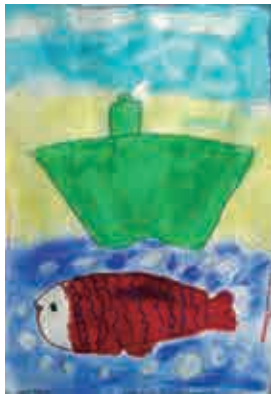
作品名:『さかなのえ』(パステル・クレパス) 作者: 藤井嶺和 (子供クラス)

宇和島市本町追手 2-8-6 TEL. 0895-22-1104 コメント: 吉田 淳治