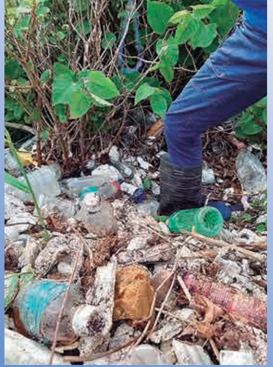
(左上) R3.7.11 ブルーサンタ うわかいまるまる海そうじ (左下) R3.12.5 奥南愛育会の皆さんと (右) 発泡の畑からペットボトルがザクザク