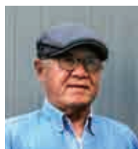
北濱 一男 写真家

1945年生まれ 宇和島市在住 学生時代からカメラをはじめが、本格的な写真歴は約20年。現在は、奈良県明日香の写真家 上山 好庸氏に師事し毎月奈良へ通う。「撮り歩きなんよ」(ブログ) http://uwatu.blog135.fc2.com/