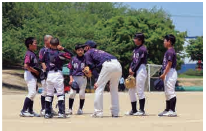
序盤、ピンチになり監督からの指示を仰ぐ選手たち

JAバンクえひめカップ県小学生男子大会兼西日本大会県予選が4月23日～5月4日の間、松山中央公園運動広場ほかで開催され、宇和島市の鶴島ジュニアチームが7月に岡山県で開催される全国大会出場を決めた。