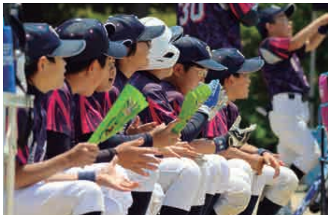
決勝戦。ベンチから大きな声援が飛ぶ。