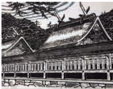
作品名:『出雲大社』(木版画) 作者: 三好断義

宇和島市伊吹町字イカリ石甲 1083-1 2F TEL.090-7784-4703 yuka@art-palette.com コメント: 清家由佳