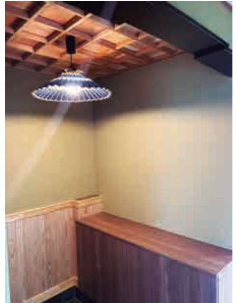
施工事例として伝統技術を取り入れた天井仕上げ

お客様の生活に合わなければ、その家は良い家とは言えません。性能の数値だけでなく、お客様の声を聞いてより良い家を建てたいと思っております。なので打ち合わせの時は、どんな些細なことでも遠慮なくお伝えしていただきたいです。