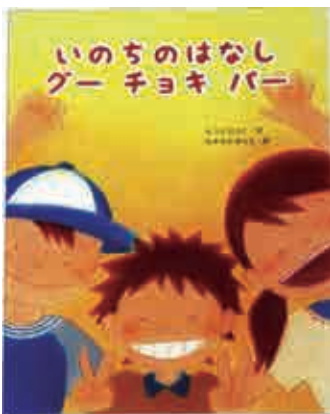
もうりひろこ(著)みずせきゆりえ(絵) 価格 1,572円(税込)