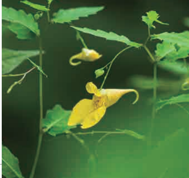
キツリフネソウ

1987年生まれ、愛媛県宇和島市出身。 子供の頃から絵を描くことが好きで、大学の卒業制作で、しかけ絵本を作り、それから絵本に興味を持つ。2016年第8回 be 絵本大賞受賞、絵本作家デビューを果たす。 現在は個展やイベントへの出品等で活動中。