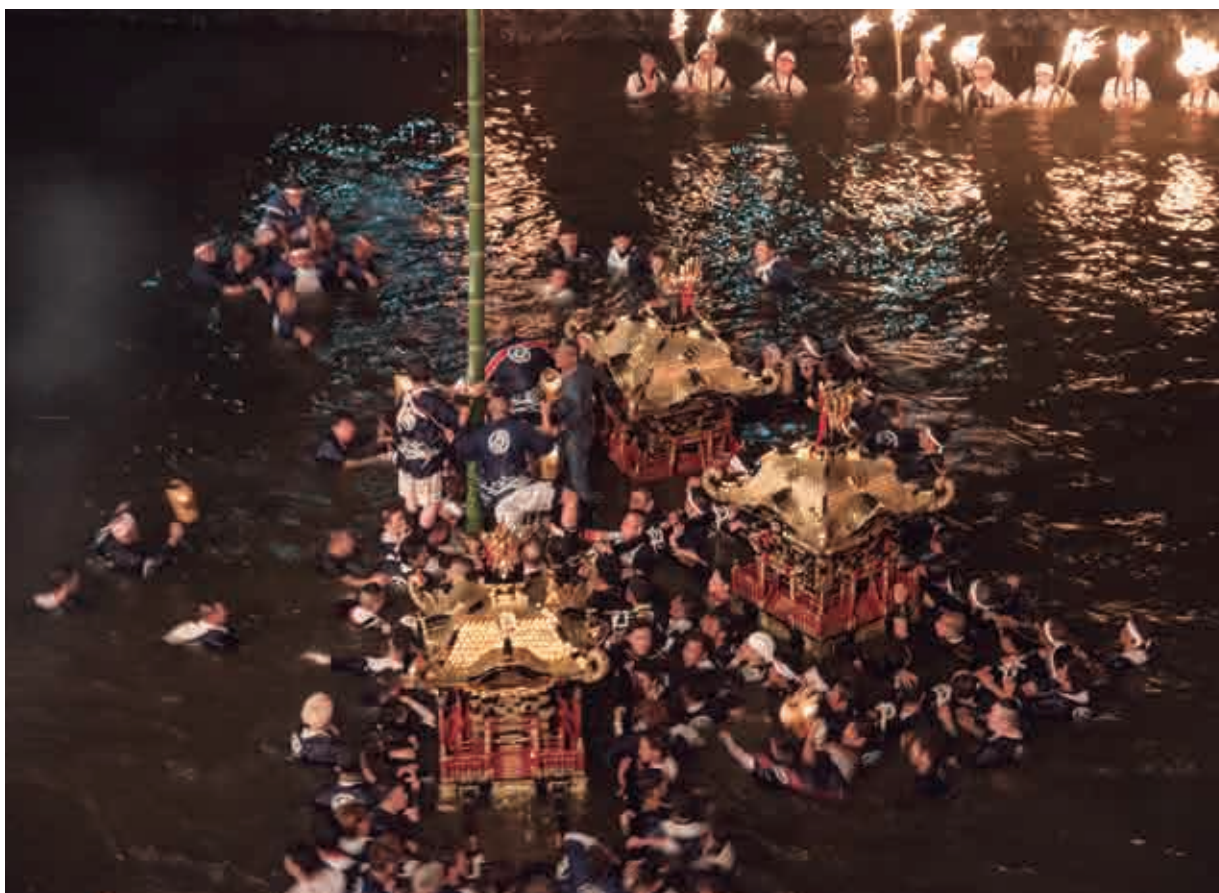
祭りのクライマックス「走り込み」。御神竹に登り御幣を奪い合う。