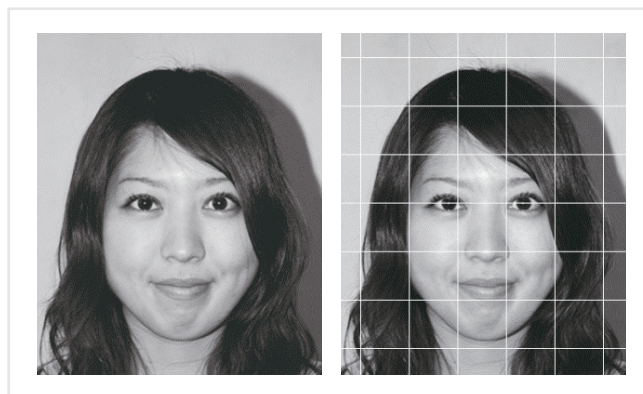
図3. 目の位置の錯視

もう一つの図3は目の位置の錯視として、前述の日本基礎心理学会の錯視コンテストに応募したものです。