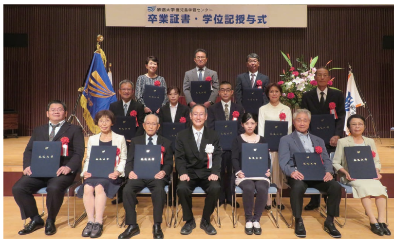
祝 令和4年度 第1学期 放送大学教養学部 卒業記念 (2022.9.25)