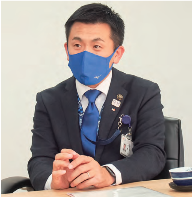
菅原文仁 戸田市長