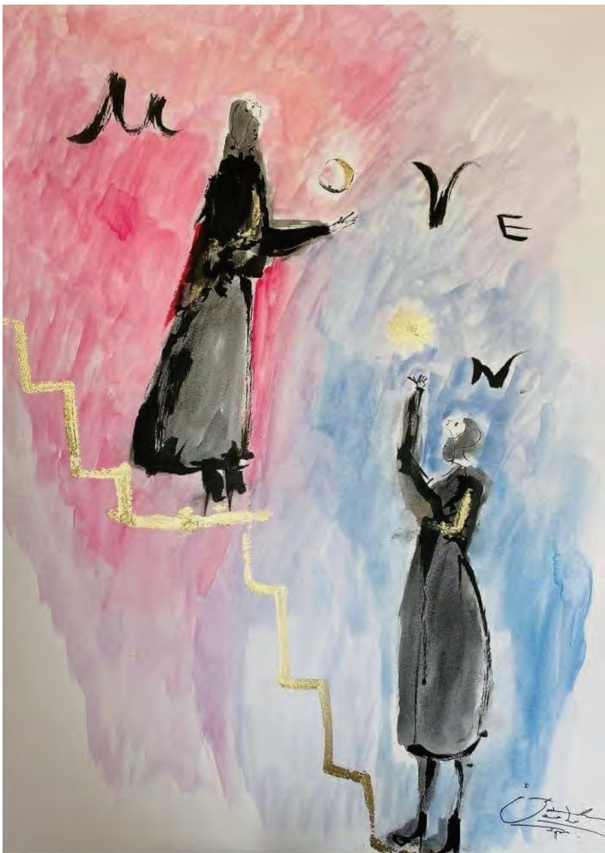
「Move On 太陽と月」あたりを照らす月と暗闇にある太陽。Move On（動き出す）事で常識を覆して新しいものを生み出そうというコンセプトで描いた。 illustration：セカイダイスケ