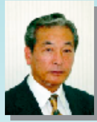
東京都老人保健施設 連絡協議会 会長