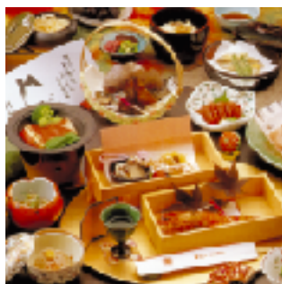
四季の富士山会席料理