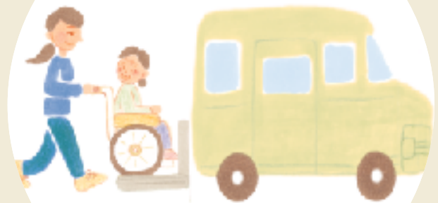
通所リハビリテーション

入浴、食事等の日常的ケアやレクリエーション、趣味のサークル、リハビリテーション等のサービスが受けられます。希望により送迎もいたします。