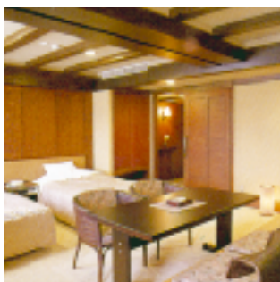
ユニバーサルデザイン・ルーム (バリアフリー)