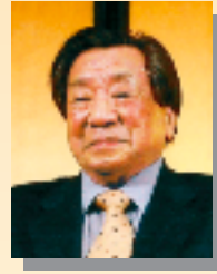
社団法人 全国老人保健施設協会 東京都 支部長