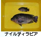
ナイルティラピア