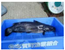
チャネルキャットフィッシュ