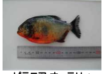
ピラニア ナッテリー