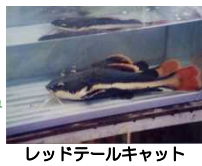
レッドテールキャット

長浜市(旧びわ町) ・クルマサヨリ ・コクチバス ・ナイルティラピア ・チョウザメ