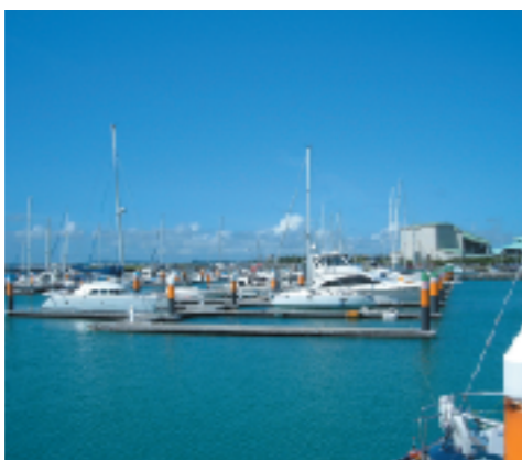
宜野湾港マリナー

また、民間企業などにとっては、多様な技術やノウハウを発揮し公共サービスの担い手となることが可能となりました。