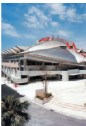
奥武山総合運動場(県立武道館)

現在、県が管理している沖縄県公文書館や県民広場地下駐車場などについても、今後は、指定管理者制度を導入する予定です。