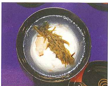
京料理展示大会で 使われていたホンダワラ