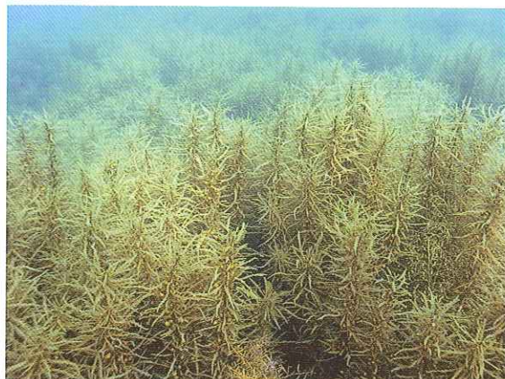
伸び始めたホンダワラ(上)と成長したホンダワラ(右)