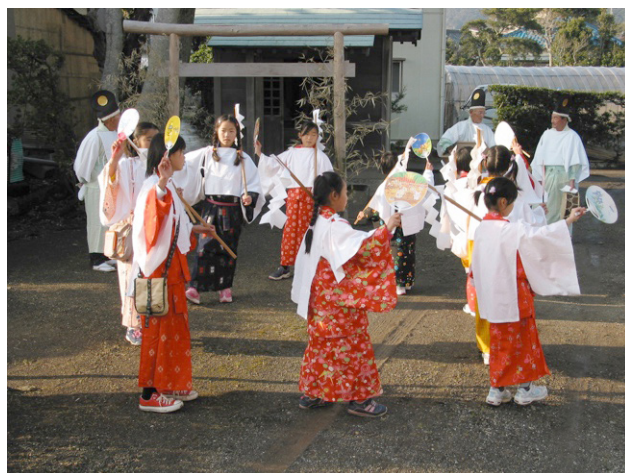
写真総-2 千葉県南房総市川口のミノコオドリ (2004年)