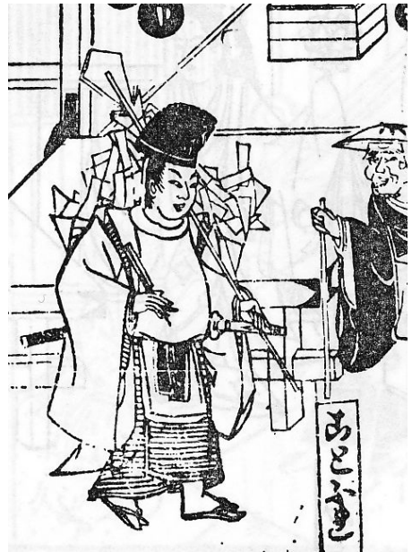
図総-1 『人倫訓蒙図彙』に描かれた「ことふれ」(朝倉 1990: 269)

とくに鹿島踊の理解の定型となっていたのが、常陸国(茨城県)の鹿島神宮から出て疫病を除けると触れまわり、また神宮の託宣によって吉凶を占うと称して