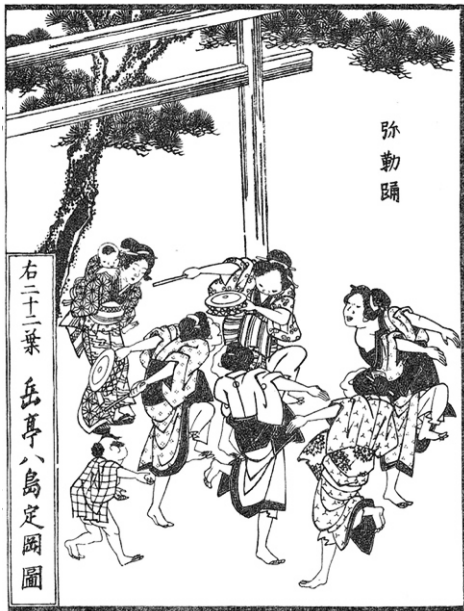
図総-2 『鹿島志』に描かれた「弥勒踊」 (北条 1997: 163)

この末尾に書かれていたのは、項目名からして「鹿島弥勒歌」のことであろう。前述の『鹿島志』には「弥勒謡」という独立した項目があり、次のように解説されている。