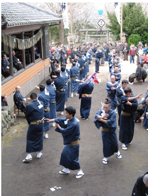
写真総-1 伊豆大島吉谷神社正月祭に 演じられる鹿島踊(2006年)