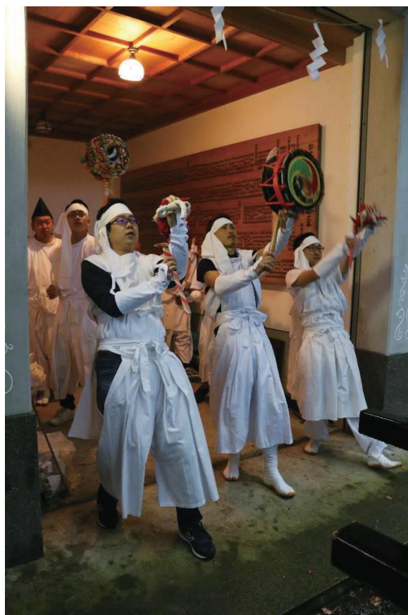
【2019年4月27日】 ※2019年の宵宮は雨天のため、屋根の下で鹿島踊を踊った。