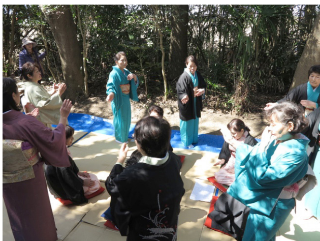
写真総-3 茨城県潮来市徳島の水神祭に演じられるみろく踊りの再現（2014年）