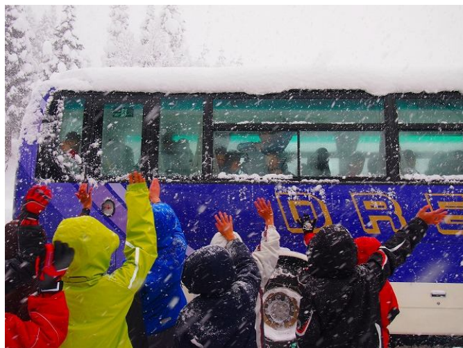
「また会おうね」と約束し、静岡の子どもたちが乗ったバスが見えなくなるまで手を降って見送りました。