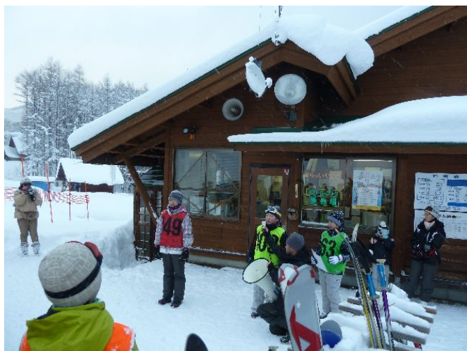
おわりのつどい はじめに皆瀬小の代表児童があいさつしました。 「3日間、秋田の冬を楽しんでいってください」