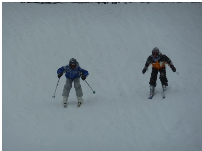
長泉町の子どもたちです。 様になっていますね。