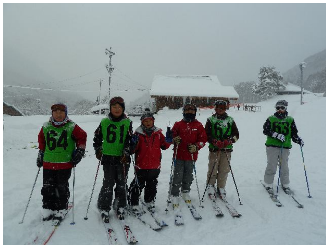
ゼッケンを付けているのが皆瀬小、付けていないのが長泉町の子どもたち。スキーが上手な皆瀬小の友だちの滑り方を見たり、一緒に滑ったりすることで、長泉の子どもたちもどんどん上達していきました。