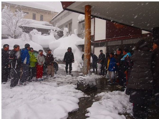
別れのつどい 長泉の子どもたちの宿泊先の旅館前に皆瀬小の子どもたちがお見送りに来てくれました。