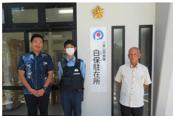
白保駐在所の視察