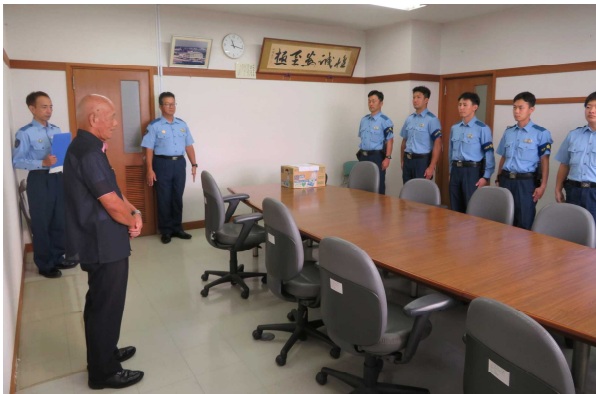
夏季特別警戒隊の激励