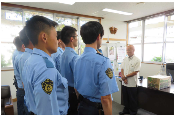
夏季特別警戒隊の激励