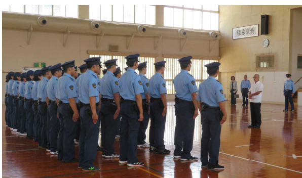
学校生への委員長訓示