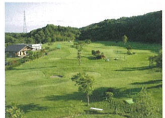
糸井の森パークゴルフ