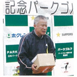
【特別賞】 遠くからよく来てくれたで賞