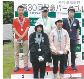
中学生・高校生の部 男女