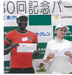
【特別賞】 ベストドレッサー賞