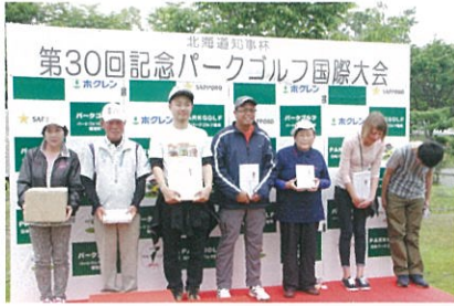
【特別賞】ブービー賞