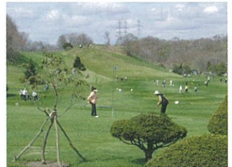
糸井ゴルフパーク54