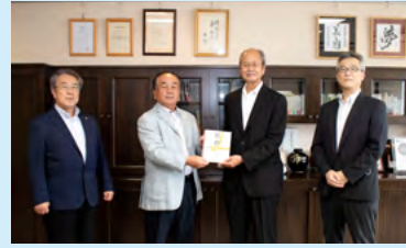
学生支援寄付金を贈呈しました

新型コロナウイルス感染症拡大防止のため、大学では今春4月からキャンパス構内への立ち入り制限や対面式授業を中止して遠隔授業が行われるなど、現役の学生は大きな影響を受けています。さらに社会的・経済的な打撃は学生の就学自体を困難にしています。