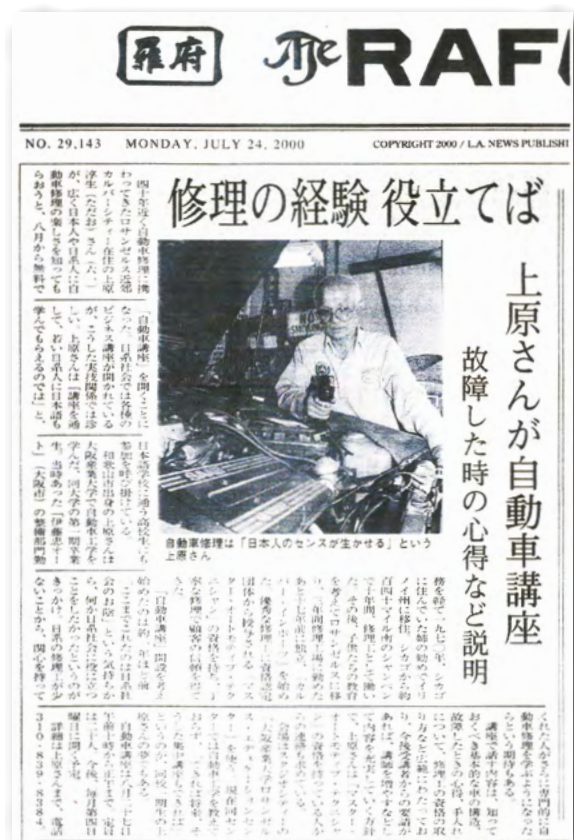
羅府新報(2000年7月24日 No.29.143)抜粋

ブアップへと心配りの毎日で、強いて言えばアメリカさんから仕事を頂けたことに大感謝しています。