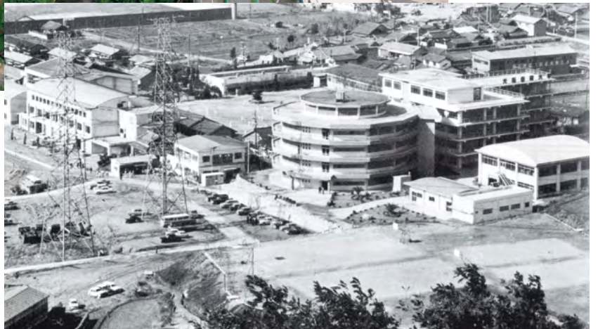
昭和40年、大阪交通大学全景