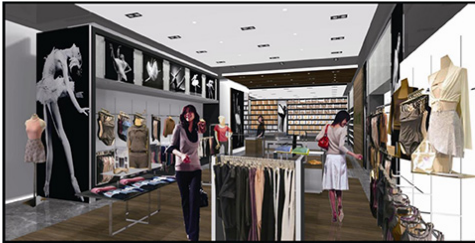
チャコット バイ フリード オブ ロンドン ニューヨーク店内観イメージ