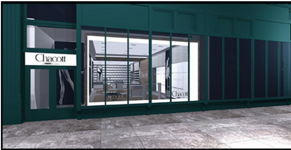
チャコット パイ フリード オブ ロンドン ニューヨーク店外観イメージ

なごみ雑貨を展開するマザーガーデンは、“親と子のふれあい”をテーマに、木のおままごとや着せ替え人形、キャラクター「しろたん」のぬいぐるみなどを取り扱います。木のおままごとは、2002年ケーキやフルーツをモチーフとして発売。以来改良を加え、多くの著名人やブロガーを通じて広まり、知育玩具・出産祝いとして人気商品となっています。現在は、食材やスイーツから、キッチンへと世界観を拡大し、日本でデザインされた繊細かつ心温まる木製おままごととして同社の主力商品となっています。「しろたん」は、“なごみ”を象徴するキャラクターです。手触りの良い抱きぐるみ・ぬいぐるみを主力に、文具・子供用衣類をそろえ、子供から大人まで幅広く愛される雑貨を取り扱います。日本発のキャラクター商品は国を問わず「かわいい」と感じていただけるものです。